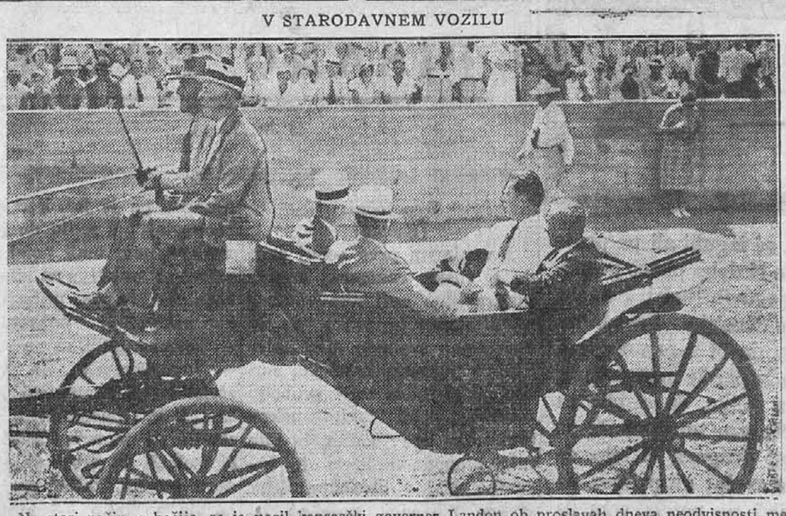
Na stari način, s kočjo, se je vozil kansaški guvernator Landon ob proslavah dneva neodvisnosti med svojimi počitnicami v Colorado. Z Landonom (na zadnjem sedežu) je coloradski guvernator Johnson.

mimo po cesti noben možki, izjeme so bile tu le nekatere ženske, ki pa so bile strogo opazovane in nadzirane, da ne bi preveč videle. Prve dni v drugi polovici tega meseca pa je bilo vzdolž meje v obmejnem pasu nad Idrijo opaziti nenavadno živahen promet. Prišlo je od 20 do 25 oficirjev, ki so pregledovali in ogledovali mejo in tozadevne naprave. Zgledalo je, da so študirali nove načrte. V Doleh nad Idrijo in okolici morajo kmetje s tlako razširiti vsa občinska pota na 5 metrov; po kanalih polagajo cementne cevi ter vse zgrada, da hočejo vsa ter poljsko pot preurediti deloma tudi direktno na račun našega kmeta tako, da bo služila za avtomobilski promet. V obmejnih vaseh: Gore, Dolenje, Zavratac je v načrtu električna napeljava za razsvetljavo. Vsi posestniki se morajo odzvati povabilu in pristati na to, da brezplačno dobavijo drogeve za to napeljava. Ostale potrebščine bo najbrže priskrbel pristojna oblast. Domače prebivalstvo pa je mnenja, da hočejo na ta način domačine izkoristiti ter pod pretvezo, da bodo oskrbeli kmetičim vasem električno razsvetljavo bodo na cenejši način prišli do električne razsvetljave za obmejne naprave ter električne pogonske sile pri delu v utrdbenih in drugih objektih. Naši fantje v Abesiniji Podatki italijanske uradne