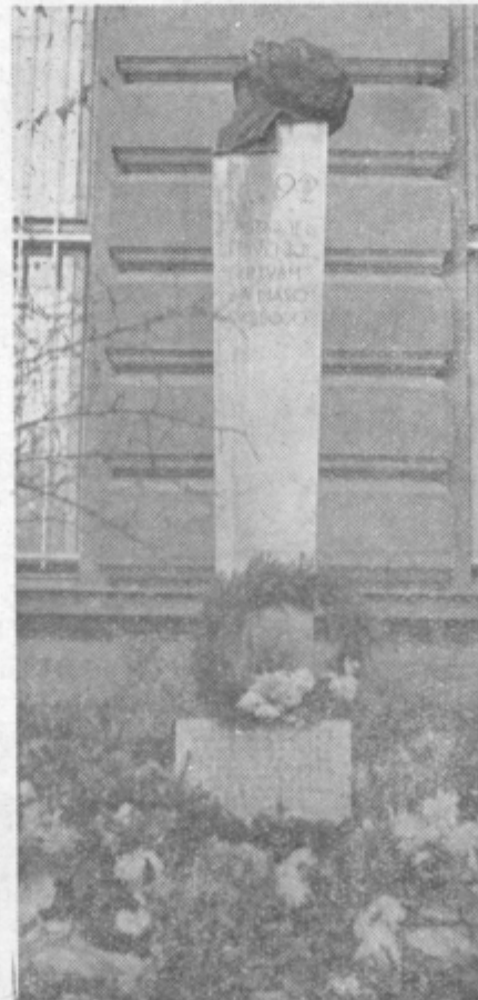
ponoči zgodilo z dekletom, ki je kradlo svečke po grobovih na sam Dan mrtvih.

Drugo jutro sem bila pri pogrebu, ko smo pokopali 18-letnega fanta. Umrl je mlad. Jetika mu je razrila pljuča. Preden so spustili krsto v jamo, sem videla, da je na dnu v vodi plavalo preko 30 napol dogorelih svečk. Te nedogorele svečke so ostale nema priča, kaj se je