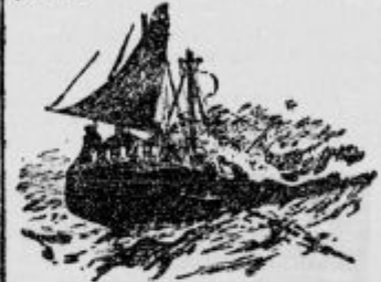
Kapitan je našel majhno ladjo.

Zdaj lahko potujemo naravnoš proti Vzhodni Indiji... Mudilo se nam je, ker smo izgubili kakih dvanajst dni. Toda veter je bil tako zasan, da nas je metal sem in tje, nanečeto da bi nas gnil naprej. Kmalu pa smo naleteli na drug pomilovanja vreden primer.