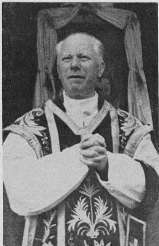
Slika škofa Rožmana iz leta 1945.

Ne pišemo Vam tega pisma radi Vas. Ne pišemo Vam ga, kakor da bi mislili, da Vi potrebujete naše tolažbe ali morda celo obrambe. Dobro vemo, da imate Vi zase in za svoje stališče dovolj tolažbe v Bogu in Marijinem Brezmadežnem Srcu, obrambe