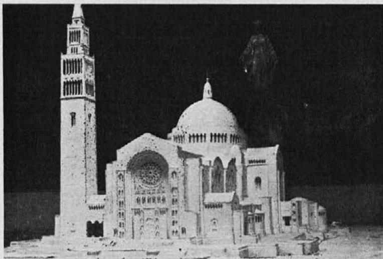
Tako bo zgedalo "Narodno svetišče Brezmadežnega Spočetja" v Washingtonu, D. C., ko bo končano.