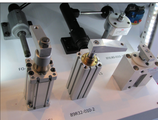
Primeri vpenjal serije 9500 v Showmobilu

V promocijskem kombiju je bila na ogled tudi zadnja novost proizvodnega programa podjetja DE-STA-CO, ki spada v serijo 9500 in predstavlja zasučna vpenjala. Ta so najbolj primerna za uporabo v aplikacijah, kjer je na voljo zelo malo prostora za gibanje. Ta prenovljena serija vpenjal tako predstavlja rešitev z mnogo bolj fleksibilnimi mo-