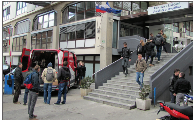
DE-STA-CO Showmobil pred Fakulteto za strojništvo v Ljubljani

obiska je bil, da zaposlene na fakulteti in študente strojništva, ki postajajo inženirji, seznanimo s programom standardnih enostavnih in