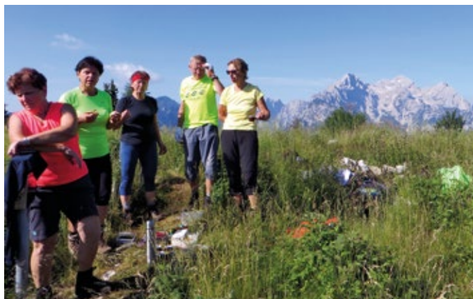
Na vrhu Jerebikovca. V ozadju Rjavina, Triglav in Cmir

Sezone še ni konec in prihodnjič sledi opis obiska lovske kočice na planini nad Sočo in vzpon iz doline Drage pri Begunjah na planino Prevalo, Begunjsko Vrtačo in Begunjsčico, pa še kakšen vrh se bo našel.