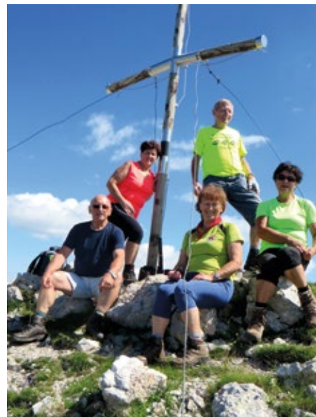
Pohodniki na vrhu Krnčice

Naslednji vzpon je bil na nekoliko bolj oddaljen vrh na meji med bohinjskimi in tolminskimi hribi. Iz Vodice smo krenili ob 4. uri zjutraj in na zanimivo turo krenili zgodaj zjutraj s planine Kuk. Na planini Razor, do koder je okoli uro hoda, in so se obiskovalci Koče na planini Razor šele prebujali, ko smo mi že hiteli mimo koč in se začeli vzpenjati po poti Škrbini (1910 m). Zanimivo je prečenje pod mogoč-