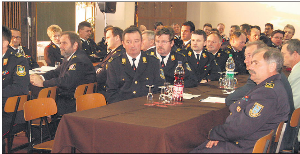
Čeprav so v Območni gasilski zvezi Ptuj dobro opremljeni in strokovno usposobljeni, se bodo morali gasilci v bodoče prilagajati na delovanje ob novih oblikah požarov in predvsem drugih nesreč.