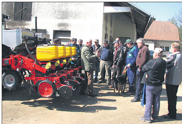
Zanimanje med člani je bilo precejšnje.

Predstavili so tudi italijanske sejalnice podjetja Mater Macc. Z njimi se lahko sejejo tako vrtnine kot tudi vsa druga semena, enostavno se zamenjajo plošče. Sejalnica je zelo natančna in dovršena. Primerna je tudi za težje pogoje setve, direktno ali mulč setev. Dobro se je izkazala v kombinaciji z že omenjeno specialno krožno brano. Kmetje so jo pohvalili predvsem za-