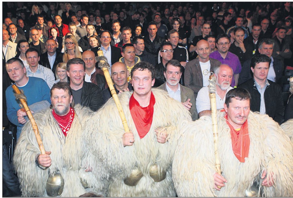
Popolnoma zapolnjen parter dvorane Tivoli so ogreli tudi kurenti.