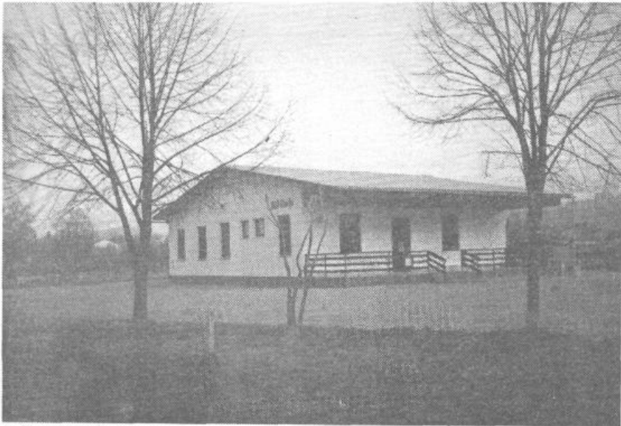
To pa je lep dom barjanskih ribičev

Ribič lahko sicer postane vsakdo, vendar mora biti pripravljen na prostovoljno delo pri ohranjanju ribjega življa. Po pristopu k ribiški družini je treba vplačati pristopni delež. To je enkratni znesek, ki se plačuje v vsaki ribiški družini. Z njim se plača minulo delo in že doseženo stanje na področju vodotokov. Po opravljenem pripravniškem stažu in izobraževanju pa je potrebno opraviti še ribiški izpit. F. V.