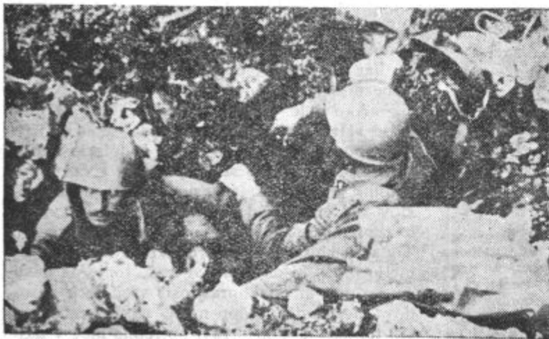
Italijanski vojaki v Albaniji, ki se pod poveljstvom generala Cavallera uspešneje branijo pred grškimi napadi

■ Italijanski pravosodni minister Grandi, dolgoletni poslanik Italije v Londonu, je te dni odrinil na bojišče. Je to že deseti italijanski minister, ki je na bojišču. Njegove posle je prevzel Mussolini.