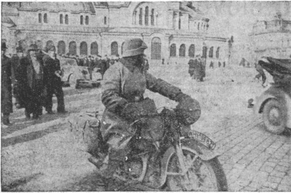
Nemški letalec pred cerkvijo svete Sofije

bolj usodnih časih, in kdor ne proži dovoljnih garancij, da ne bo samo spoštoval, temveč tudi podpiral pridobitve političnih izkušenj, ta ne služi niti kralju niti državi. Zbiranje je mogoče samo okoli temelja, na katerega je bila postavljena naša notranja politika 26. avgusta 1939. Kdor drugače misli, ta stavi na krivo karto.