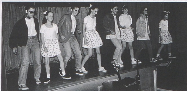
Muzikel Grease (slika zgoraj) in igra „Čudežna srajca Dopetajca“ (slika levo) sta bili glavni točki domskega praznika.