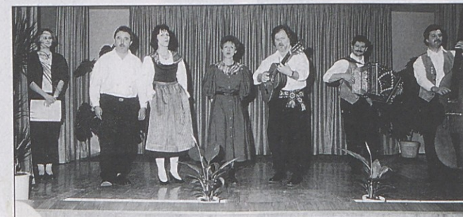
Velik ljubitelj Milkinih pesmi je ansambel Korenika.