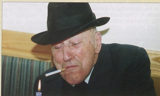
Šmihelski dekan Srienc se svojim faranom oprošča, ker bodo odslej njegove nedeljske maše krajše, ker bo težko zdržal brez cigaret.