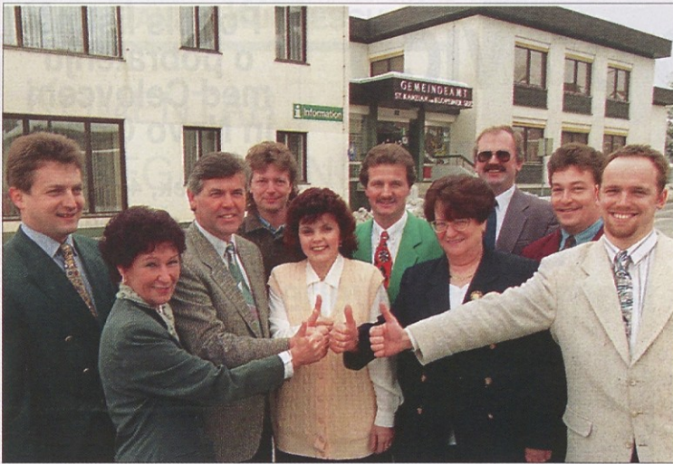
GWL v Škocijanu si je zastavila kot volilni cilj pridobitev glasov ter se dež v občinskem predstojništvu.