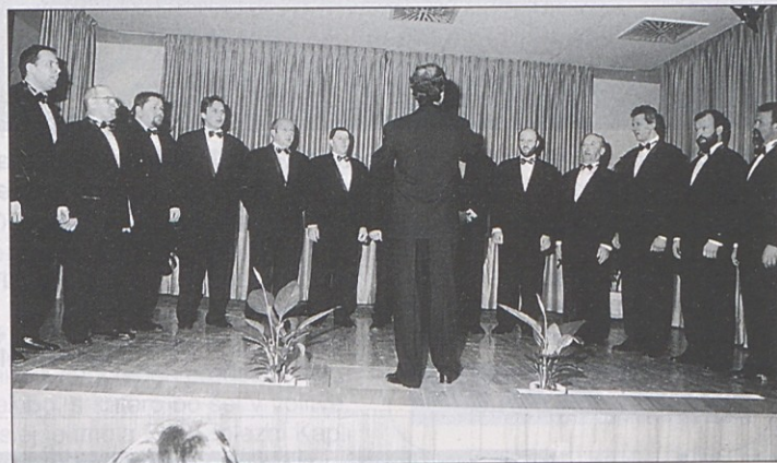
Matjaževci iz Libuč so pripravili lepo spominsko svečanost.

Koncert je izzvenel s pesmijo, ki jo je zapela vsa dvorana in tako dodatno potrdila geslo prireditve: Njihova pesem nam bo vedno pela.