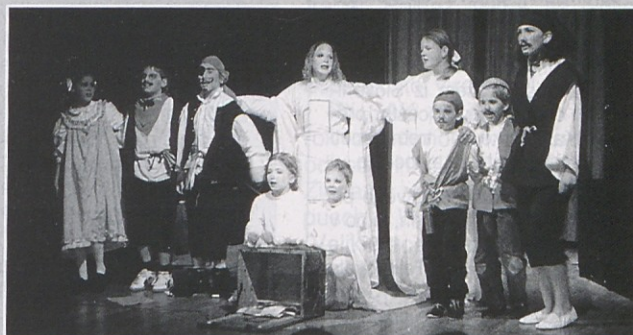
Mladi boroveljski gledališčniki so navdušili številno občinstvo.