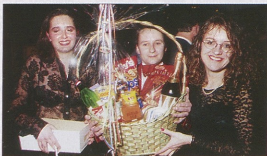
Posebno bogat je bil srečolov. Obiskovalci so morali ugotoviti težo košare z dobrotami, ki je tehtala 9,7 kg.