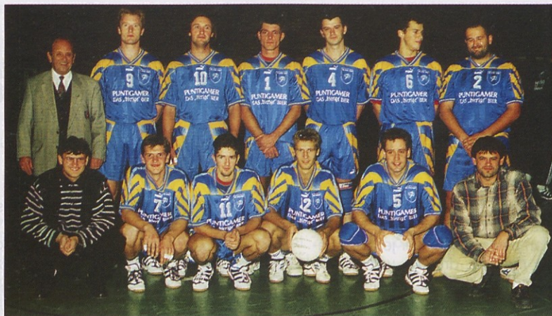
V prihodnji sezoni bodo zastopani v evropskem pokalu – SK Dob.

Z zmago proti Sokolu (3:1) si je ekipa trenerja B. Ivartnika predčasno zagotovila nastop na evropskem pokalu (tekmovalja bodo po vsej verjetnosti novembra). Še prej pa čaka Dobljane druga težka preizkušnja – namreč najti novega glavnega sponzorja.