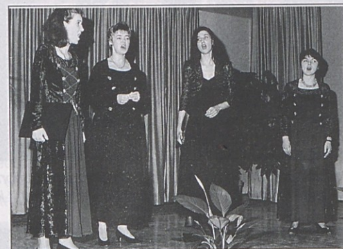
Koncert je sooblikoval ženski kvartet Kvarta.