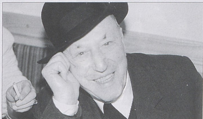
Cigareta je zapeljiva stvar, ki lahko spravi v škripce celo šmihelskega dekana, ki še nikoli ni kadil. Ali si jo je tokrat le prižgal?