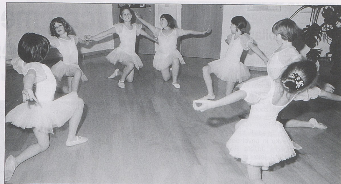
Novost Slovenske glasbene šole: baletne plesne skupine v otroškem vrtcu Naš otrok ter v Bilčovsu.

Njegove slike so ena sama poezija ustvarjalnega srca, ki sicer ve za togobe sveta, a jih miselno in čustveno premaguje s sprotnim optimizmom, ki zasluži za vsemi dogajanjem in dogodki neki globlji smisel bivanja in večnostne harmonije.