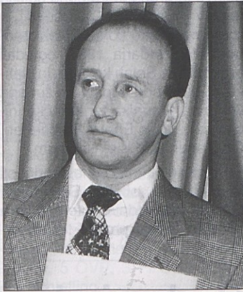
Iz Milkinih del je bral F. Kuežnik.