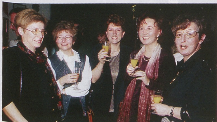
Tradicionalni ples je znan tudi po zastopnicah nežnega spola, ki niso samo žavbrne, temveč se znajo prav tako odlično zabavati.