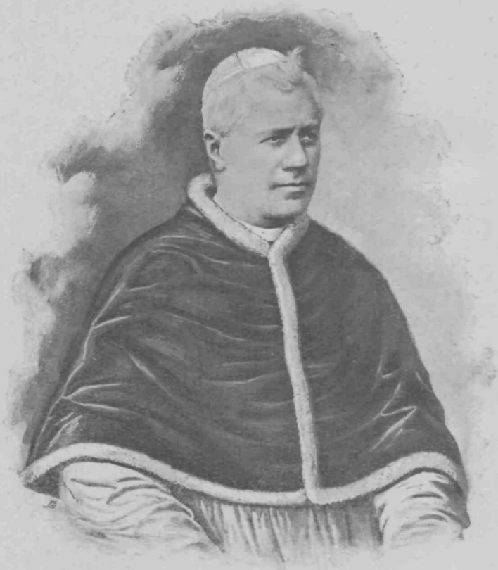
† Sveti oče papež Pij X.