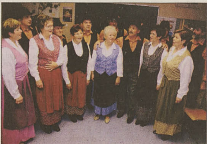
Sekcija ljudskih pevcev Ajda