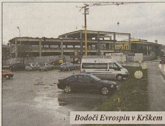
Bodoči Evrospin v Krškem