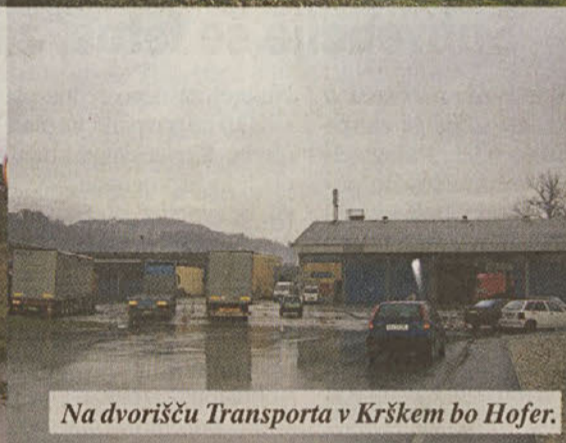
Na dvorišču Transporta v Krškem bo Hofer.