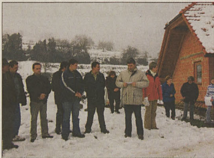
Slovesnost ob odprtju vodovoda

je bilo potrebno zgraditi 3392 m cevovoda, vodovodno omrežje pa naj bi v drugi fazi razpeljali še naprej po KS. Vrednost investicije, ki so jo financirali KS, občina in v izdatni meri tudi program SAPARD, je 85 milijonov SIT.