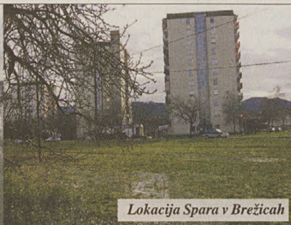
Lokacija Spara v Brežicah