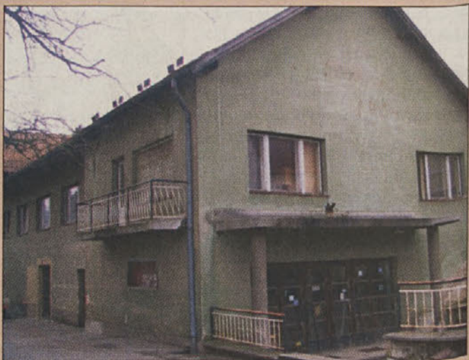
Osvobodni dom Svobode Krško

Medtem ko prihaja do prvih zamud pri gradnji savskih elektrarn, se odmika tudi polaganje temeljnega kamna za novo krško knjižnico, zato pa hitro rastejo obsežni prostori podobne ustanove v Brežicah!