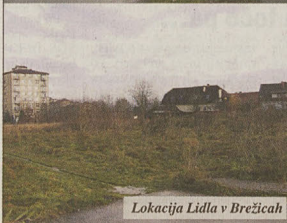
Lokacija Lidla v Brežicah