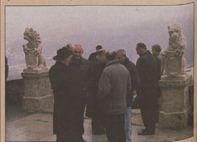
Grad je potreben še nove fasade, pred tem pa bo prišla na vrsto obnova pročelja rezidence baronov Moškonov, ki stoji v grajskem parku. N.Č.C.

Sevnica - Srednjeveška zgodovina Sevnice je tesno povezana z gradom, ki je bil prvič izpričan leta 1323. Grofje Moškoni, ki so grad kupili leta 1595, so dotedanjo renesančno trdnjavo spremenili v udobno baročno rezidenco. Grad je kasneje doživel mnoge preobrazbe, v zadnjih dveh letih pa je bil deležen prenovne v višini 20 milijonov SIT. Na hodnikih so bile restavrirane stropne poslikave iz 16. stoletja, obnovljene so bile stene in tla, ki so tako manj nevarna in bolj praktična za čiščenje. Prenovo pa je doživel tudi razgledni balkon pred gradom. Strokovnjaki Restavratskega centra iz Ljubljane so prenovili balkon in ograjo, ob razglednem balkonu pa po 25 letih spet stojita znamenita kamnita leva. Eden je bil v celoti ohranjen, v drugega pa so restavrirali vložili veliko dela, da so ga obnovili. Na gradu tako stojita repliki levov, originale pa bodo prihodnje leto razstavili v gradu.