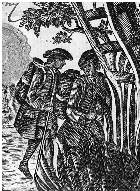
Pomočnika na poti. (Priporočilo kotlarskega pomočnika. 1795, maj 23., Mainz. SI ZAC 786, 36 Kotl)

pomočništva in podelitvi mojstrstva ter prevedbo za pogostitve predpisanih zneskov v prispevke v cehovsko blagajno. Podobno pot naj bi ubrale tudi številne globe za manjše disciplinske prekrške, ki so jih prej z veseljem (in tudi na grešnikovo zdravje) spustili po grlu: »Vse globe, ki jih ceh izreče in izterja morajo v skladnico (v dobrodelne, socialne namene; op. p.), nikakor pa jih ni dovoljeno 'zažreti ali zažlampati' (verfressen, oder versoffen)«, je zapovedovala terezijanska strogost. 31