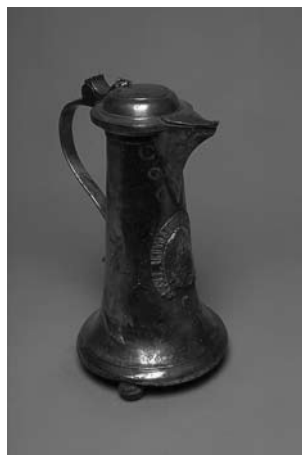
Cehovski vrč za vino je bil tih, a nepogrešljiv spremljevalec cehovskih druženj. (Kositer, dat. 1776, višina 33 cm. Pokrajinski muzej Celje)

S popivanjem (»pojedino«, »malico«), ki se je novi vajenec resnici na ljubo (verjetno) ni aktivno udeležil (plačali so jo njegovi starši, včasih – običajno ob vpisu – tudi mojster) se je začelo cehovsko življenje smrkavega vajenčka: »Ko je mladenič iz častitljive družine sprejet v uk za 3 ali 4 leta,