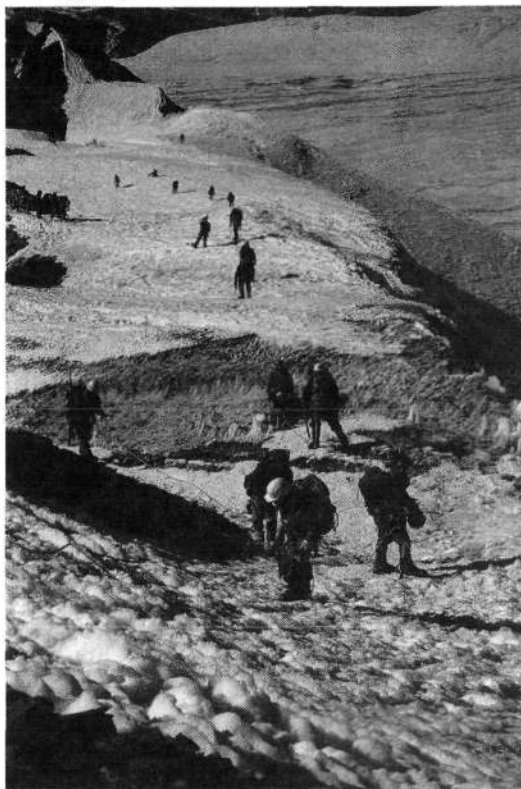
Tečajniki so se natančno spoznali tudi s hojo in reševanjem na ledeniku

NMA je za tečaj — šolo izbrala 32 kandidatov, ki so jih na NMA prijavile različne agencije, ki se v Nepalju