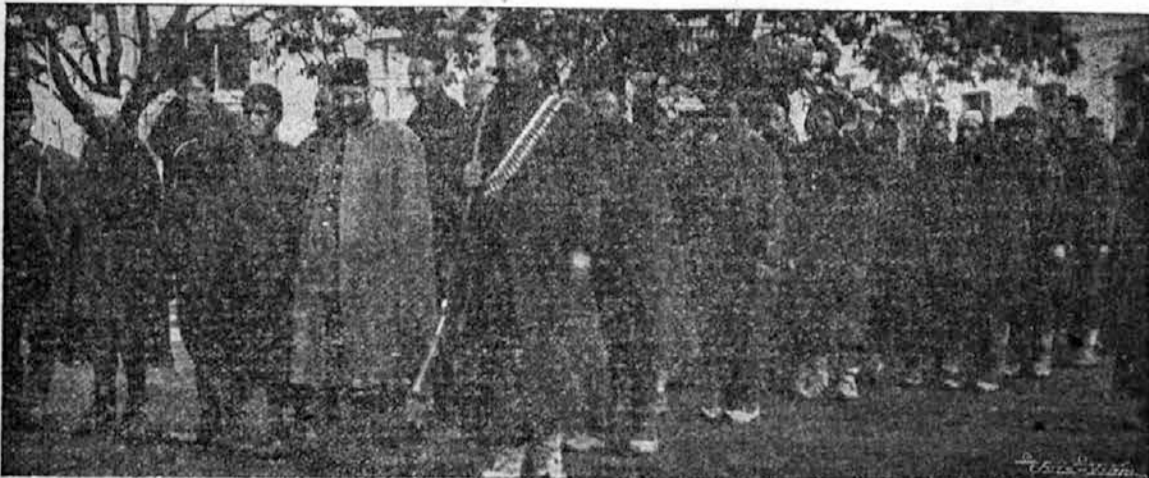
Turški ujetniki v Sofiji, v glavnem bolgarskem mestu. Stoletni tlačitelji jugoslovanskega kmeta se vračajo, obkoljeni od bol-

Da se kuga pijančevanja od našega naroda odvrne, je potreba, da se obrne razumništvo od pijančevanja, ker beseda malokdaj zaleže, ampak vzgled vleče. Zato ne bo poprej bolje, dokler bodo boljši sloji pijančevali. Kadar bo to delo izvrše-