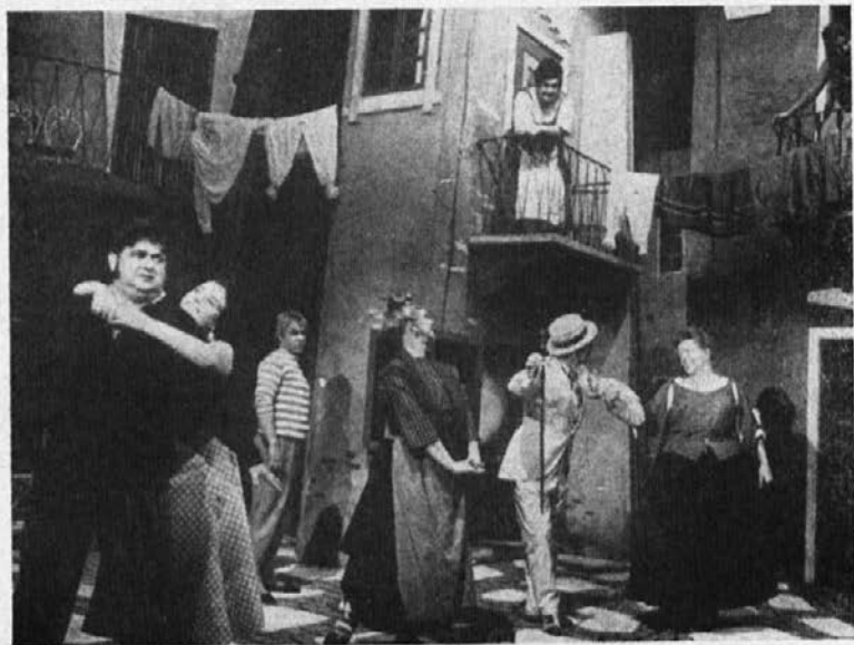
Prizor iz »Zdrahe na trgu«

1. slika: Med gromom in bliskom se pojavijo tri vešče, ki čakajo na prihod kraljevega poveljnika Macbetha, da bi mu prerokovale bodočnost. Z Macbethom pa pride tudi Banquo. Vešče pozdravijo Macbetha kot sira Cawdorskega, obenem pa mu prerokujejo, da bo postal škotski kralj, vendar pa bodo pozneje vladali kot kralji Banquovi potomci. Vešče se izgubijo, pred Macbethom pa se pojavijo poslanci kralja Duncan, ki mu prinašajo častni naslov sira Cawdorskega. S tem se je izpolnila prva prerokba vešč in v Macbethu zagori želja, da bi se polastil kraljevega prestola in bi se s tem uresničila še druga prerokba.