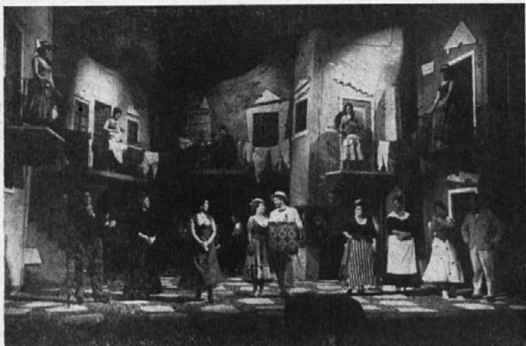
Prizor iz »Zdrahe na trgu«