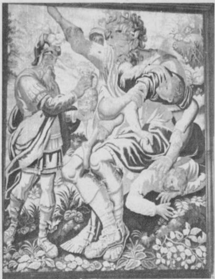
»Odisej ponuja Polifemu pijačo«, flamska tapiserija z začetka 17. stoletja (inv. št. UO 488 T). Ta tapiserija je bila izbrana, da jo prvo restavriramo. Novembra 1984 smo jo napeli na valja restavratorskih stavev v restavratorskem ateljeju v tekstilni tovarni v Majšperku. Fototeka kulturnozgodovinskega oddelka PMP št. F 276.