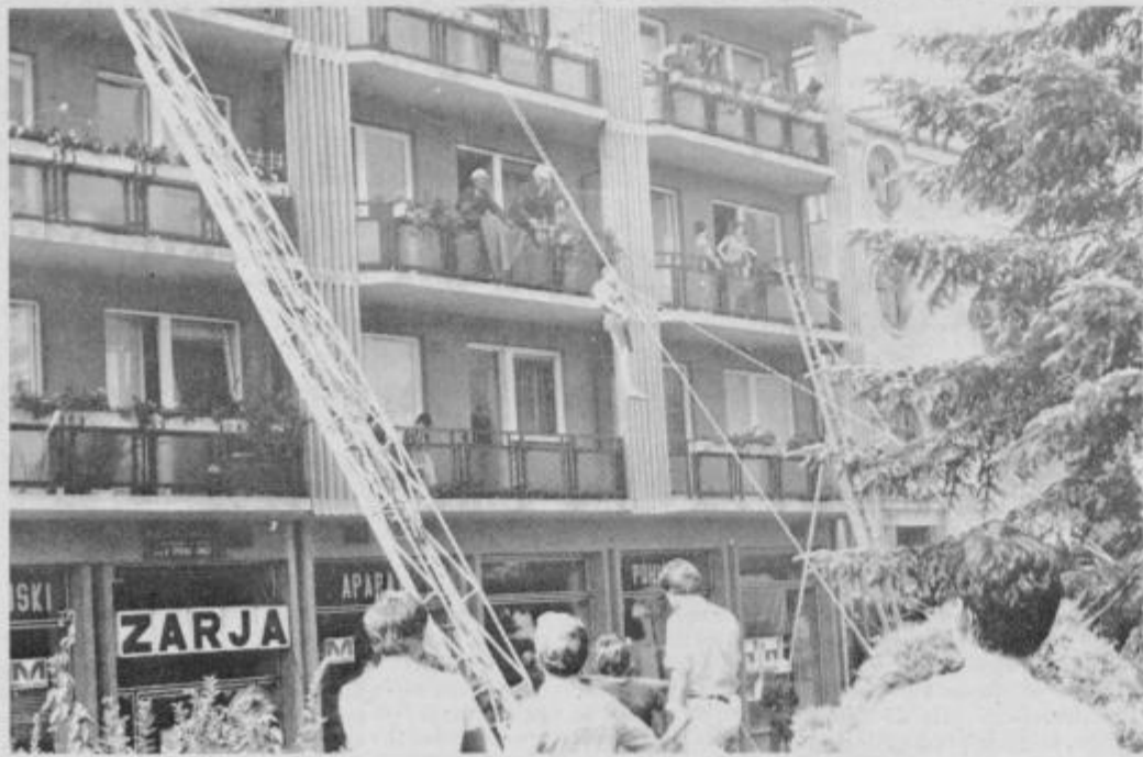
Med reševanjem »ponesrečencev« iz poškodovanih blokov na Kolodvorski ulici.

V vaji je sodelovalo 580 udeležencev. Poleg krajanov KS Ormož, zaposlenih v DO Slovin KK Jeruzalem, Mercator-Zarja, OŠ Ormož in Petrol, ter poleg zgoraj omenjenih enot in štabov civilne zaščite iz osmih hrvaških in sedmih slovenskih občin so v vaji sodelovali še: gasilska društva Ormož, Hardek, Ključarčica, Loperšice in iz tovarne sladkorja Ormož; tozd Zdravstvena postaja Ormož, občinski center za obveščanje in alarmiranje, občinski štab TO Ormož, postaja