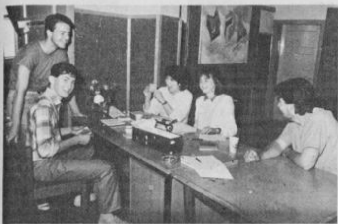
V študentskem servisu je vedno živahno.

»Urno postavko določimo mi v servisu in sicer jo korigiramo z osebnimi dohodki v proizvodnji. Tako zaslužijo za uro fizičnega dela od 600 do 900 dinarjev, odvisno spet od narave dela. Najnižja urna postavka pa je 450 dinarjev in sicer za čiščenje prostorov. Na splošno pa mislim, da je v večini primerov študent pri svojem delu prek našega servisa dokaj izenačen s tistimi, ki takšna ali podobna dela opravljajo v redni zaposlitvi.« M. Ozmec