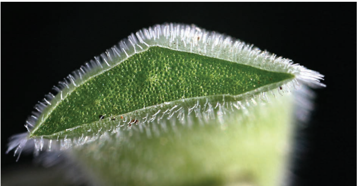
Slika 4: Prečni preseki lista žlezastolistnega netreska Figure 4: Leaf cross section of S. osti-jarej