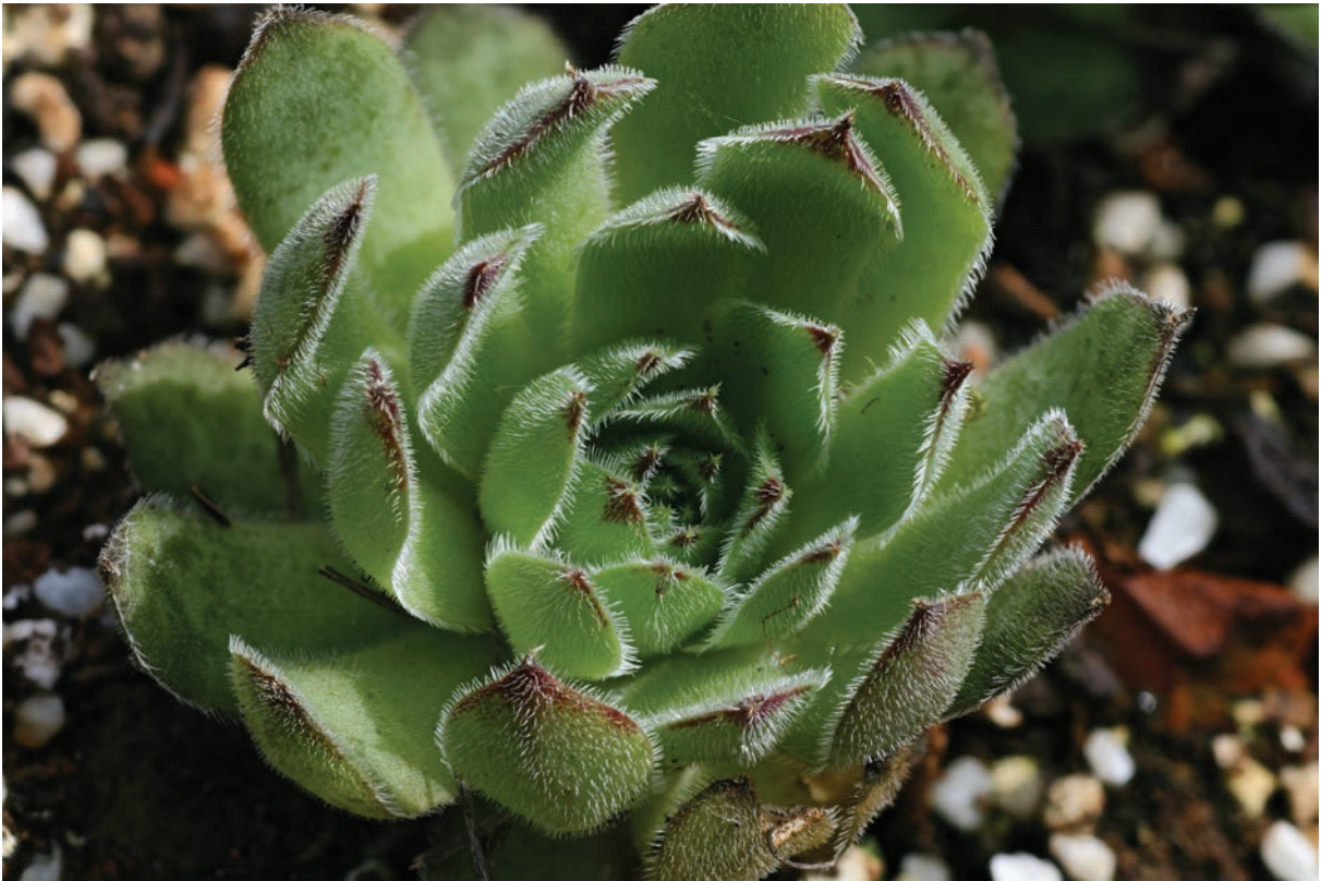
Slika 3: Žlezastolistni netresk Sempervivum osti-jarej nom. prov., spregledana populacija, odkrita leta 2013 Figure 3: Sempervivum osti-jarej nom. prov., an overlooked population, found in 2013