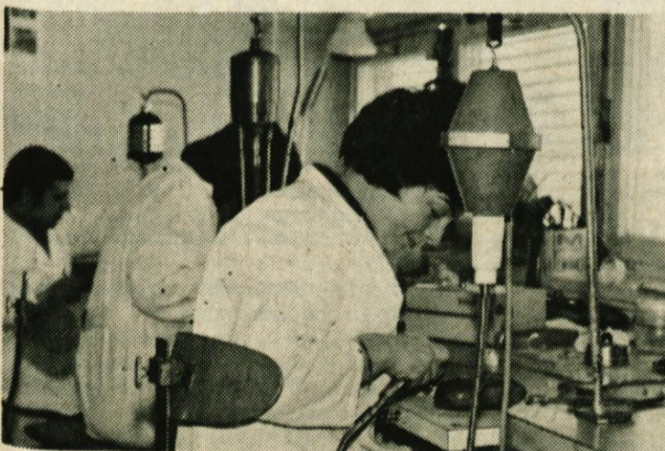
Zobotehnična delavnica v logaškem zdravstvenem domu