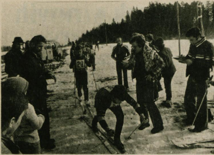
Notranjsko ligo v klasični kombinaciji odlikuje predvsem resnost, množičnost in borbenost mladih tekmovalcev iz vseh krajev Notranjske