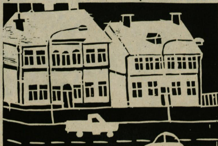
„Pogled skozi okno“ Rozana Tollazzi s. šola „8 talcev“