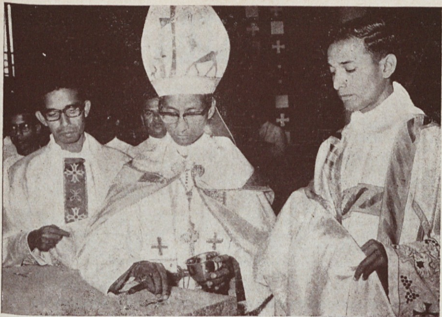
Bangalorški škof posvečuje glavni oltar v cerkvi novega tamkajšnjega salezijanskega bogoslovja, ki ga vidimo spodaj.