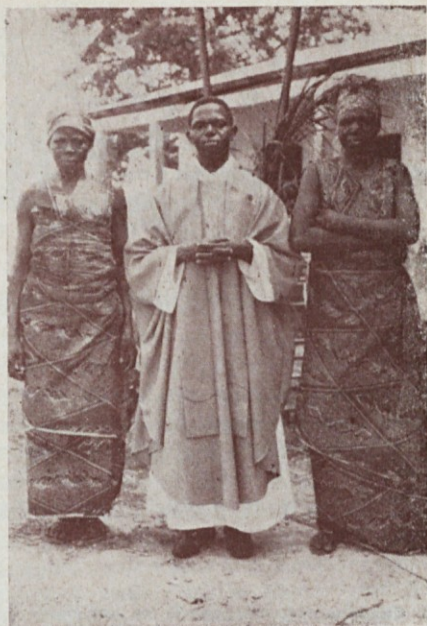
Novomašnik z materjo oziroma materami; oče je bil poligam. Njegova rodna mati je na njegovi levi.