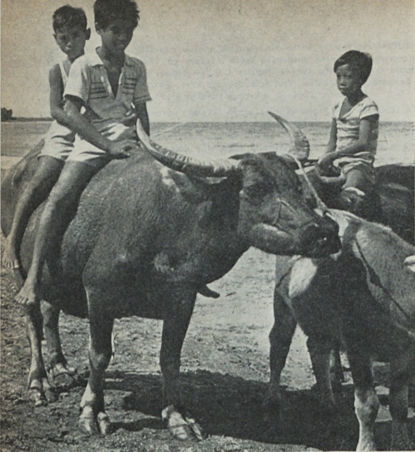
Indijski pastirčki na paši . . .

Registro de Prop. Int. No. 1096912 Director responsable, Lenček Ladislav Domicilio legal, Cochabamba 1467 Buenos Aires