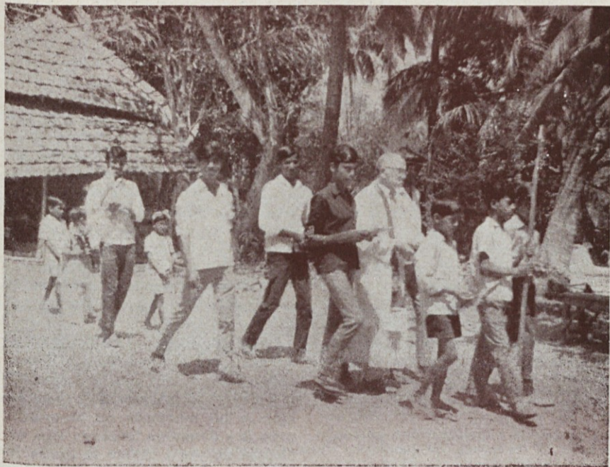
O. Poderžaj piše k tej sliki: „Mudi se nam“ na žegnanje nove vaške cerkve v vasi Bhendru. Tile fantje so iz Kalyanpurja, vzeli sem jih seboj — domačini niso znali hoditi v procesiji, pa so ostali zadaj. . .

podatkov, jih bom rad skušal posredovati, da bo druga izdaja življenjepisa v tem izpopolnjena.