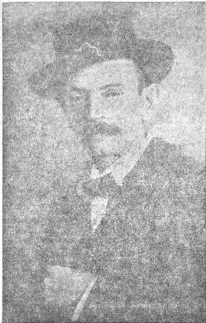
Vi, ki imate v srcu mladost in v pesti moč, vi glejte! Ob vaših plečih bo slonelo življenje! Ivan Cankar