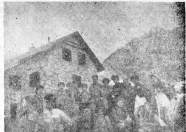
Taborniki Toplega vrelca iz Topolšice

Da lahko družina uspeva, imata nemalo zaslug zdravilišče in Tovarna usnja v Soštanju, ki sta materialno in moralno podprla delo društva.