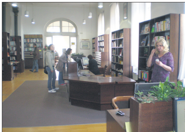
Izposoja v oddelku za odrasle

Ormož • Predstavitev gimnazijskih projektov