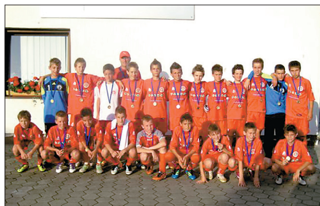
Prvaki, NK Aluminij Kidričevo U-12

tako da je bilo možno skorajda v »živo« spremljati dogajanje na letališču.