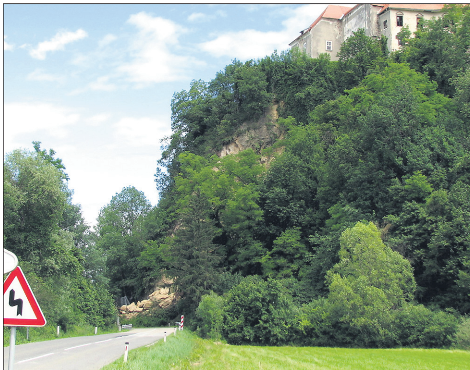
Ogromen plaz v borlski pečini je popolnoma zasul edino cestno povezavo z mednarodnim mejnim prehodom Zavrč, obvoza za tovorna vozila ni, zelo vprašljivo pa je tudi stanje samega gradu Borl, saj obstaja velika verjetnost, da se v globel zruši tudi grajsko poslopje ...

Nekaj Cirkulančanov, ki si je plaz ogledalo že v torek, nato pa še v sredo, pravi, da se plazenje, sicer manj vidno, še vedno nadaljuje. Oglasili pa so se tudi člani cirkulanskega Društva za oživitve gradu Borl (DgB), ki opozarjajo, da gre za katastrofo državnega pomena, in v javnem pozivu prosijo za pomoč: „Menimo, da bi morali vložiti vse možne napore, da se hitro in ustrezno zaščiti in obvaruje kulturna dediščina na našem območju. Sama nesreča ima