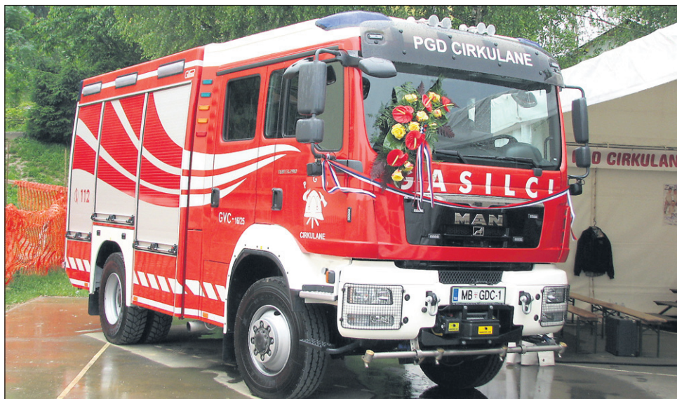
Dolgo pričakovano sodobno opremljeno vozilo Man TGM 13-290, vredno 230.000 evrov, je po sobotni slovesnosti zdaj že uradno v rokah domačih gasilcev.