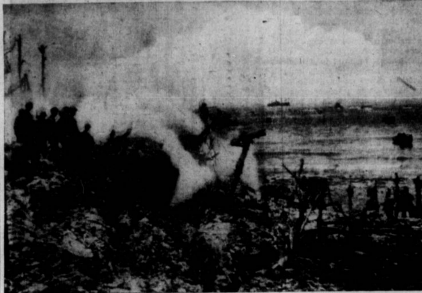
JAPONSKI VOJAKI so vztrajni ljudje. Bore se do zadnjega, vrh tega so tudi jako zvičajni in zavratni. Skrivajo se v goščah in napadajo iz zasede. Gornja slika predstavlja, ko so jih Američani z granatami primorali iz skrivališč.

Z ljudstvom Italije je vredno simpatizirati. Vredno je, da se mu pomaga državo demokratično organizirati. A v Italiji bi bilo praktično izvedljivo edino, ako se odpravi privilegije in njeno gospodarstvo pa socialistično organizirati. A to bogne! To bi ne bila demokracija, ampak "komunizem"! Tudi Lui-