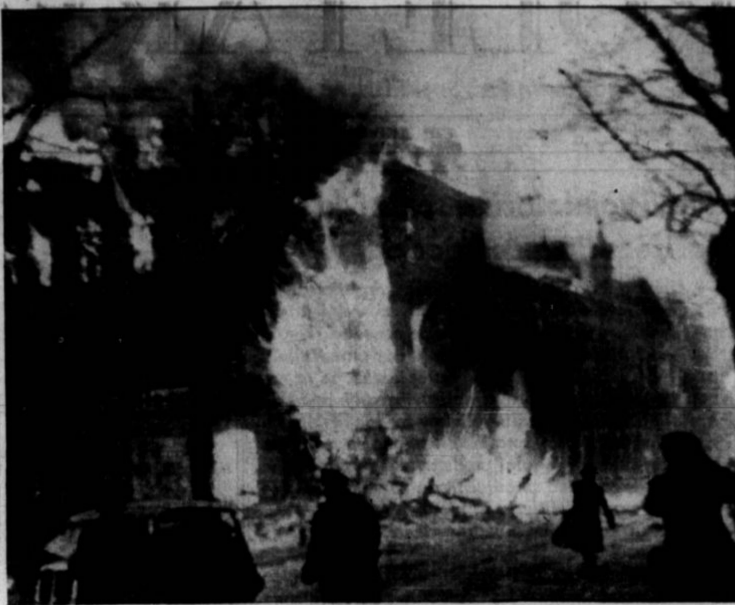
BALTIŠKO OBREZJE, ki ga je do nedavno kontroliral Hitler, je sedaj že domalega "rusko jezero". Goraje je prizor iz Gdanskega (Danzig), ki so ga nacistične čete ob svojem umiku pred rdečo armado zažigale. Poljska vlada v Lublinu, sedaj nastanjena v Varšavi, je Gdansko pridružila k poljski republiki.

Urad za statistična raziskavanja v trgovskem departamentu pravi, da se je način obratovanja tako izpopolnilo, da lahko sedaj produciramo toliko kot leta 1940 z osem milijonov delavcev manj, kot pa jih je bilo za isto količino produkcije takrat treba. In tehnika se še vedno zboljšuje. "Efficiency" tudi. Torej bo treba po vojni za tolikšno produkcijo, kot je znašala leta 1940,