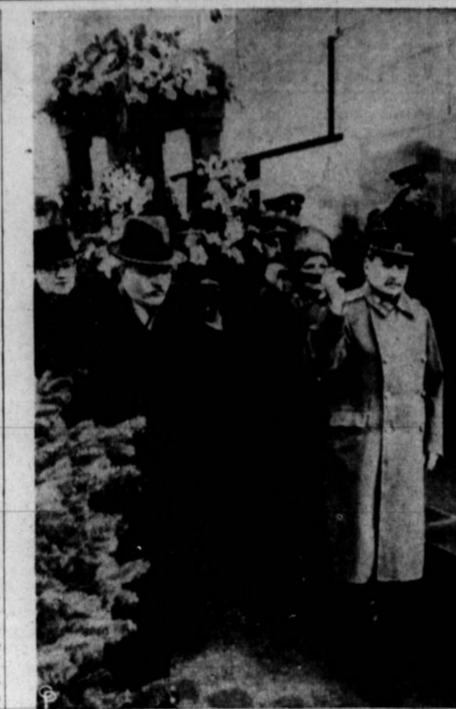
JOSEF STALIN gre baje Churchillu in našemu državnemu departamentu jako na živce. Na sliki na desni je on, na levi Molotov, na pogrebu marsala Sapošnikova.

Da dragi rojaki, njih sre ne bo obudila krasna narava pomladi. Oni se ozirajo potrti in z žalostnimi očmi na svoje domove, a pred seboj vidijo le o-