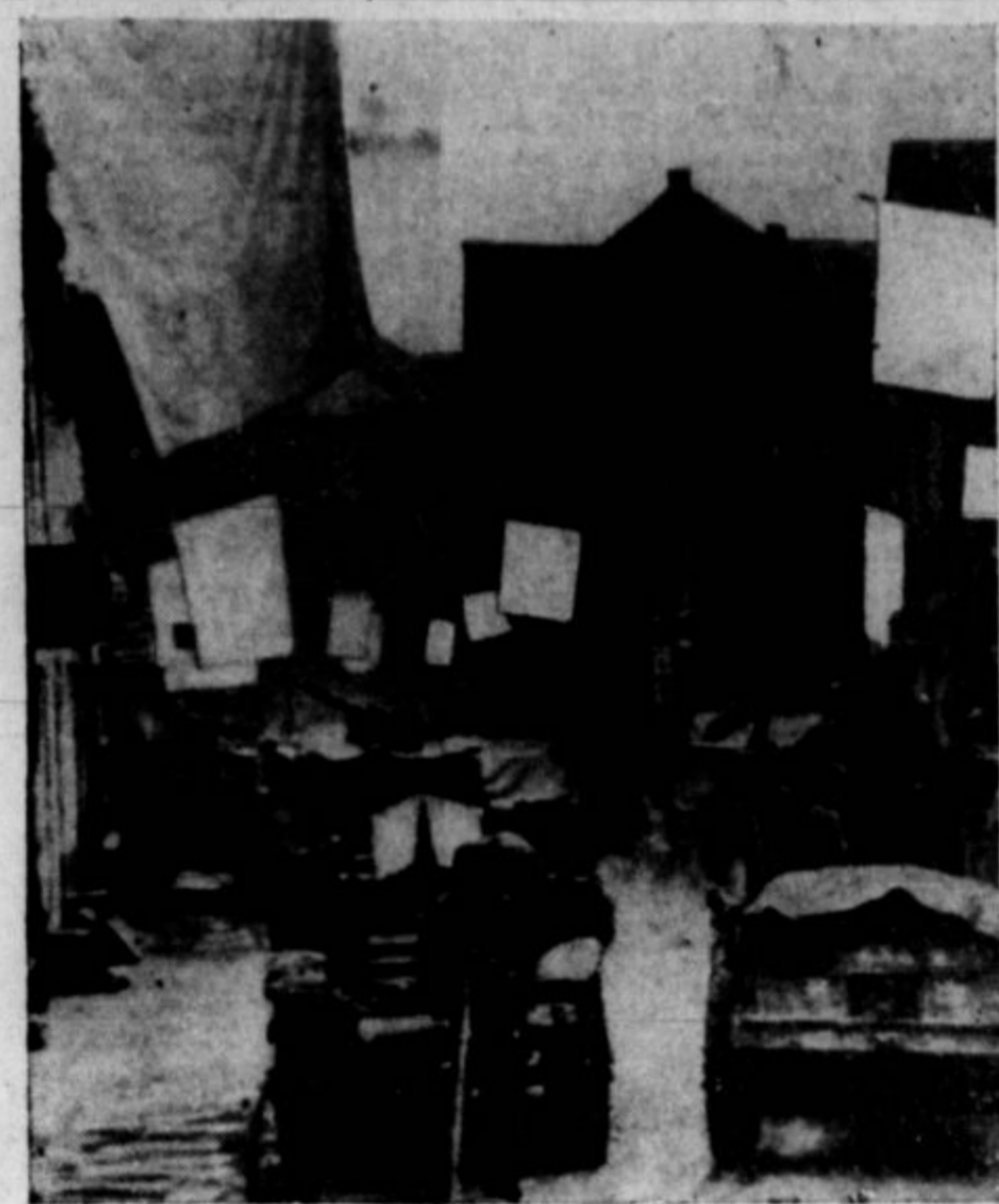
BELE ZASTAVE v Nemčiji že dolgo niso bile tako v običaju kakor so zdaj. Povsod, kamor se bližajo zavezniške armade, jih razobešajo, nepočni in podnevu. Gornje je slika z zapadne fronte iz nekega mesta blizu Berlina.