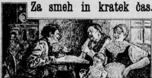
Za smeh in kratek čas.

Občni zbor slov. katol. društva za kamniški politični okraj bo letos v Mengšu dné 30. avgusta, na angeljsko nedeljo, popoldne ob pol 4 pri Jelenu. Može od blizu in daleč le skupaj! Pride tudi kateri gg. poslancev.