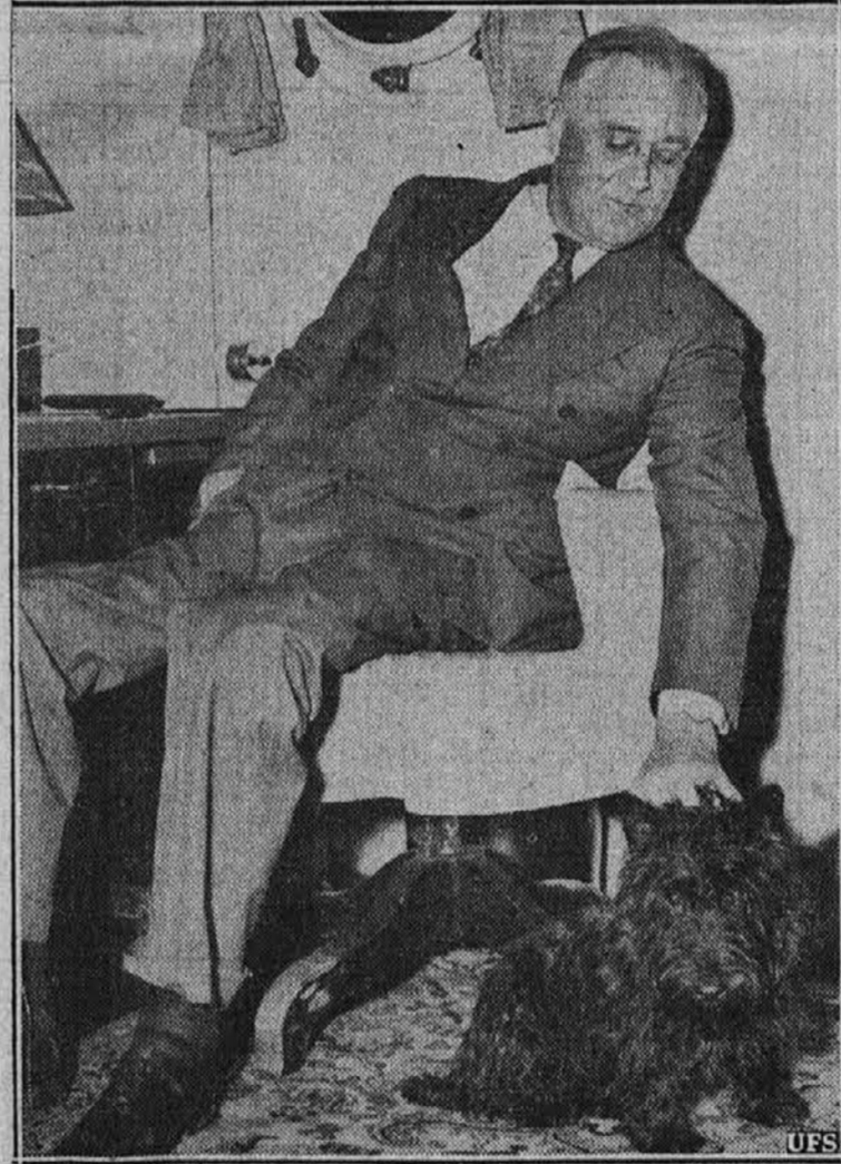
Slika nam predstavlja predsednika Roosevelta in njegovega psička "Scottie-a," ko sta se nahajala na ladji Tuscaloosa ob priliki pregledovanja obrambnih postojank na morju.