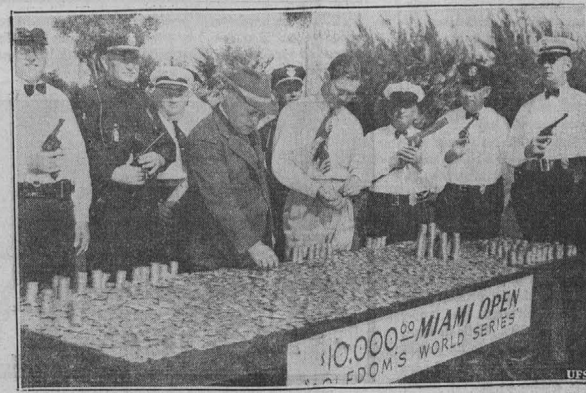
Byron Nelson iz Toledo, O., svetovno znani prvak v igranju golfa zve na 10.000 s. obrnih dolarjev od katerih je $2.500 njegovih, ko je zopet zmagal v tekmi v Miami, Fla.