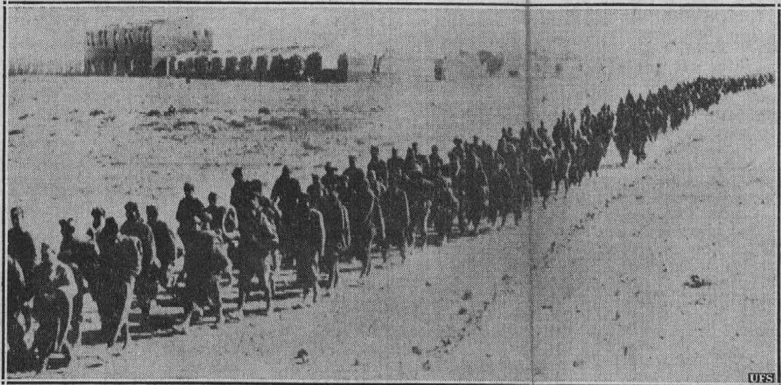
Da, pohod, pa nič kam . . . To je namreč nepregledna vrsta italijanskih vojakov, ki so jih zajeli Angleži v Afriki in ki jih ženejo zdaj v ujetništvo. V ozadju vidite razvaline mesta Sidi Barrani, kjer so Angleži zajeli več kot 10,000 Italijanov.