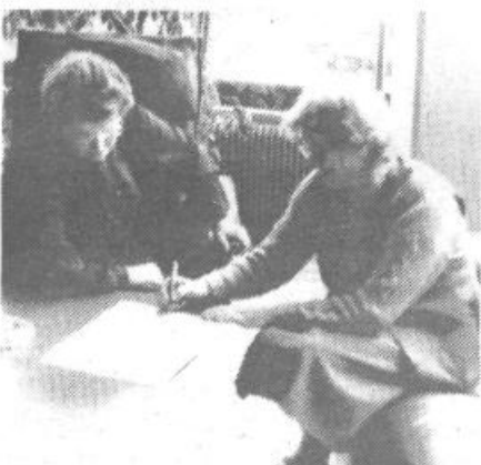
27. februarja iz Ilirije-Vedrog: S svojim podpisom se opredeljujemo proti uvedbi izrednega stanja ter se zavzemamo za mir in sožitje v SAP Kosovu.

Delegati zborov skupščine občine Ljubljana Vič-Rudnik želimo, pa tudi zahtevamo, da se razmere čimprej sanirajo. Želimo pravno in demokratično družbo, ki bo omogočala artikuliranje različnih interesov in razreševanje problemov v legitimnih institucijah političnega sistema. Zato nasprotujemo uvedbi