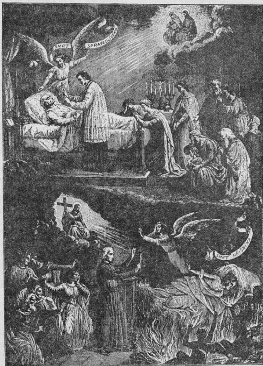
Dragocena v očeh Gospodovih je smrt pravičnega, strašna pa smrt grešnika.