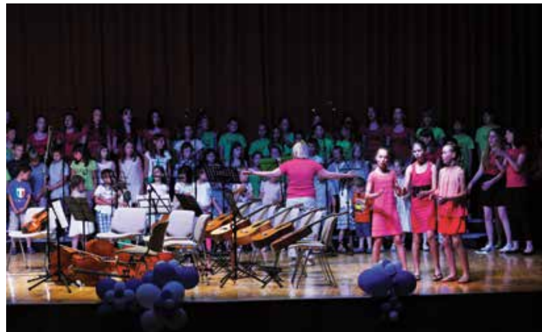
Iz zaključnega nastopa, foto Alen Jerinič.