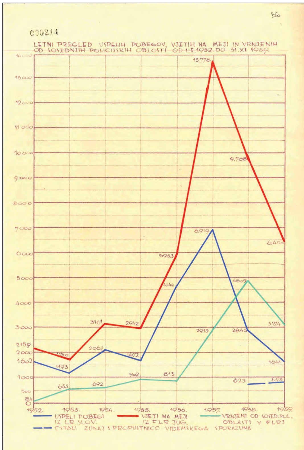
Slika 2: Letno poročilo Državnega sekretariata za notranje zadeve Ljudske republike Slovenije o številu ljudi, ki so poskušali pobegniti preko slovenske meje v petdesetih letih 20. stoletja, 1959 (ARS, AS 1931, t.e. 1440, Letno poročilo Državnega sekretariata za notranje zadeve Ljudske republike Slovenije za leto 1959)