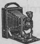
Foto- Kino- aparate

in potrebščine kupite ugodno v drogerijah KANC, Ljubljana in KANC, Maribor.