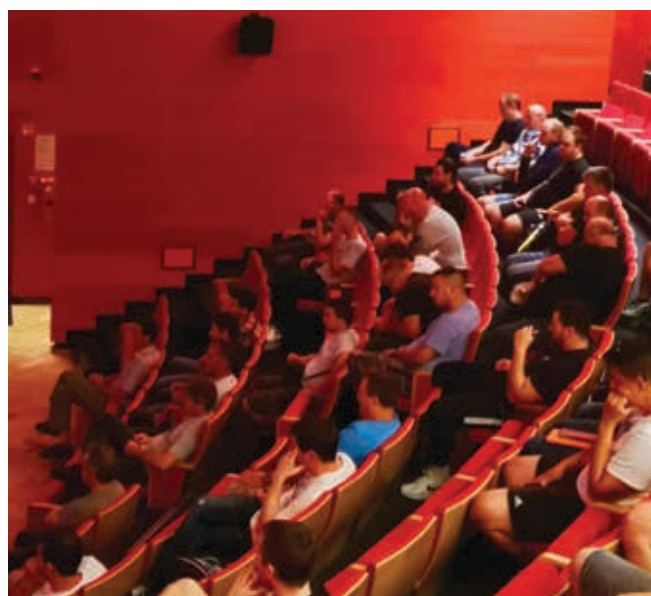
Predavalnica je bila polno zasedena.