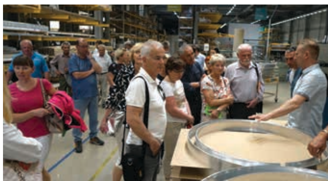
V proizvodnih prostorih podjetja Intra Lighting

Sledila sta ogleda dveh uspešnih inovativnih podjetij. Intra Lighting v Šempetru pri Gorici je globalni ponudnik pametnih rešitev za razsvetljavo. Instrumentation Technologies iz Solkana pa vodilno svetovno podjetje na področju najsoodobnejših instrumentov za trg diagnostike pospeševalnih žarkov in rešitev za druga tehnološko zahtevna področja.