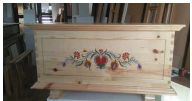
Lesena skrinja, v kakršnih so nekdaj hranili oblačila in druge vredne stvari

Pripadnosti organizaciji, kot smo jo čutili dolga leta, ni več čutiti. Združenje, zbornica nam je bila kot drugi dom. Od