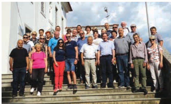
Na stopnišču frančiškanskega samostana na Kostanjevici

Koristno smo združili s prijetnim in si po strokovnem delu ekskurzije ogledali še markantni Frančiškanski samostan Kostanjevica v Novi Gorici, priložnost pa je bilo okušati tudi tamkajšnjo kulinariko in vinski turizem – Vinarstvo Čarga, Vinarstvo Cejsar in Vinarstvo Karara.