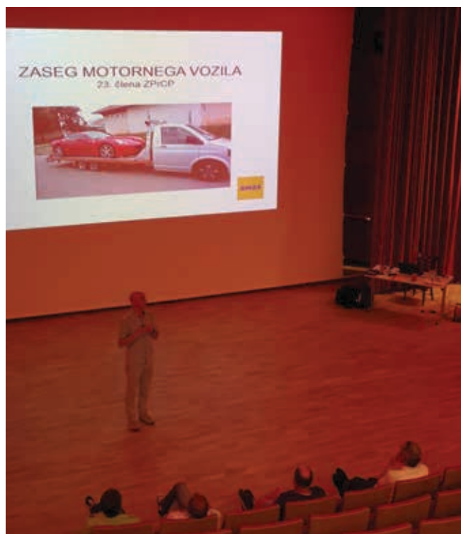
Ena od tem izobraževanja je bila tudi »zaseg vozila«.