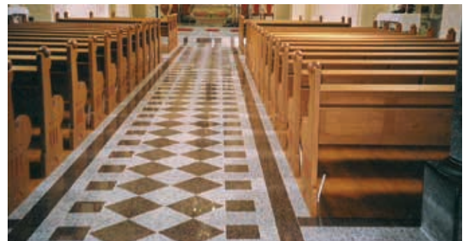
Klopi v borovniški cerkvi