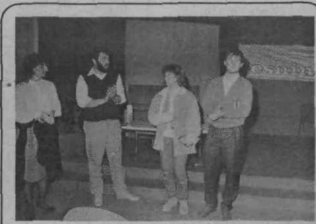
SMUČARJEM PLAKETE OBČINSKE KONFERENCE ZSMS

● V osnovnih organizacijah ZSMS potekajo množične priprave za sprejem učencev 7. razredov v članstvo ZSMS. Za vse sedmošolce so bila organizirana predavanja.