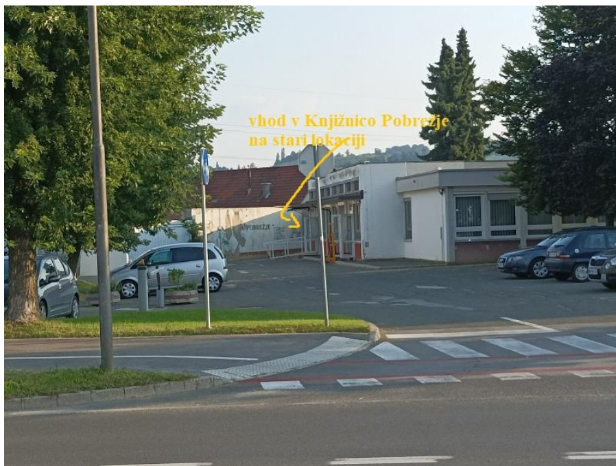
Slika 1: Vhod v Knjižnico Pobrežje na stari lokaciji

Lokacija knjižnice je bila slabo vidna, za uporabnike je bilo namenjenih le nekaj parkirnih mest, ki so bila v souporabi z uporabniki URI Soča, ni bila umeščena ob zgoščenem naselitvenem področju območja, dobro je bila dostopna z javnim prometom, do nje je bila speljana kolesarska steza in pločniki. Dostop do Knjižnice Pobrežje na stari lokaciji je prikazan na Sliki 1.