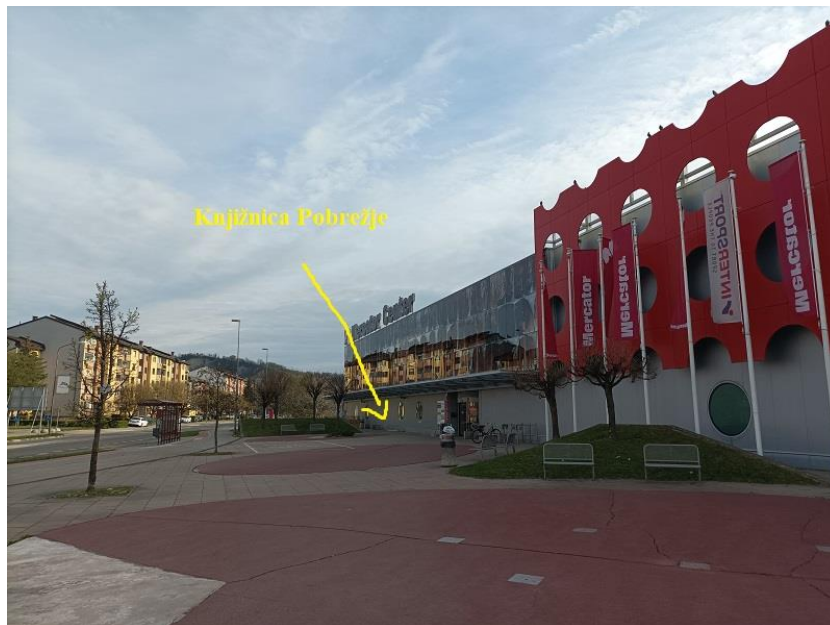
Slika 2: Umeščenost Knjižnice Pobrežje v trgovskem centru (pogled od zunaj)

Knjižnica ima skupen vhod s trgovskim centrom, uporabnikom so na voljo pokrito parkirišče in skupni toaletni prostori. Umeščena je v samo središče centra v pritličju. Je odprtega tipa: ima širok vhod brez vhodnih vrat, zvoki in glasba s hodnikov nakupovalnega centra so slišni v notranjost knjižnice, ena stranica knjižnice je prosojna steklena površina. Nasproti vhoda je kavarna in slaščičarna, poslovne sosede so cvetličarna, živilska trgovina, restavracija, otroška igralnica, papirnica, trgovina za male živali, frizer, športna trgovina, trgovina z oblačili, butik in optika. Umeščenost knjižnice v notranjosti trgovskega centra prikazujeta Slika 3 in Slika 4.