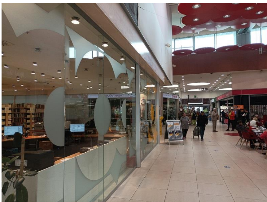
Slika 3: Umeščenost Knjižnice Pobrežje v trgovskem centru (notranjost 1)

Knjižnica ima skupen vhod s trgovskim centrom, uporabnikom so na voljo pokrito parkirišče in skupni toaletni prostori. Umeščena je v samo središče centra v pritličju. Je odprtega tipa: ima širok vhod brez vhodnih vrat, zvoki in glasba s hodnikov nakupovalnega centra so slišni v notranjost knjižnice, ena stranica knjižnice je prosojna steklena površina. Nasproti vhoda je kavarna in slaščičarna, poslovne sosede so cvetličarna, živilska trgovina, restavracija, otroška igralnica, papirnica, trgovina za male živali, frizer, športna trgovina, trgovina z oblačili, butik in optika. Umeščenost knjižnice v notranjosti trgovskega centra prikazujeta Slika 3 in Slika 4.