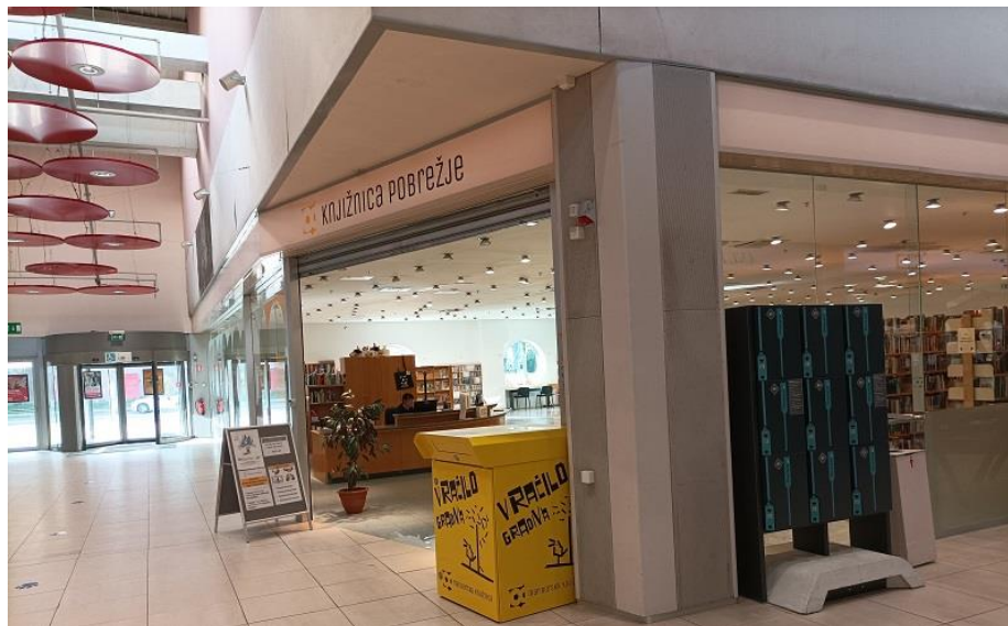
Slika 4: Umeščenost Knjižnice Pobrežje v trgovskem centru (notranjost 2)