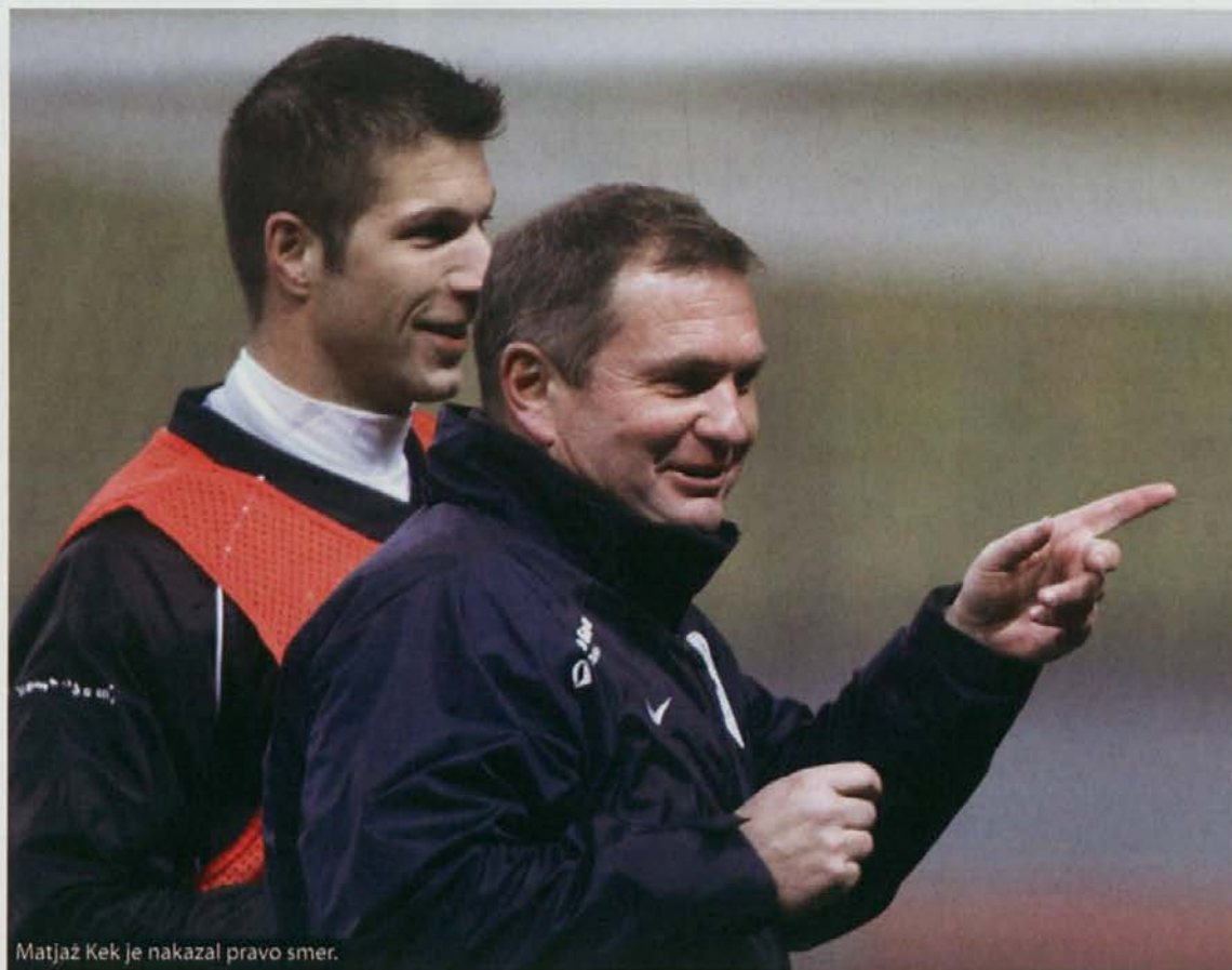
Matjaž Kek je nakazal pravo smer.

»V težkem obdobju Brane Oblak ni znal sestaviti niti ne zmotivirati igralcev. Strokovno vodstvo nekdanjega nogometaša ni bilo kos dodeljeni nalogi. Po slabih igrah in rezultatih ga je zamenjal Matjaž Kek.«