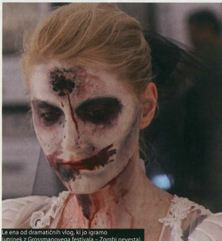
Le ena od dramatičnih vlog, ki jo igramo (utrinek z Grossmanovega festivala – Zombi nevesta).

dejstvo, da se določeni v vlogah počutijo varno. Vedo, kaj se od njih pričakuje in kaj lahko pričakujejo, ter nočejo razdreti navidezne varnosti. Ne dovolijo, ne pustijo, ne izpustijo tako druge kot sebe iz filma. Pri tem se mi poraja vprašanje, ali je možno preklopiti iz vloge, brez odobritve soigralca? In čemu ta reagira z jezo, kadar se nekdo noče igrati igre vlog? Če grem