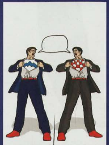
Naslovnica: Jernej Žumer