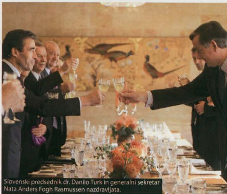
Slovenski predsednik dr. Danilo Türk in generalni sekretar Nata Anders Fogh Rasmussen nazdravljata.