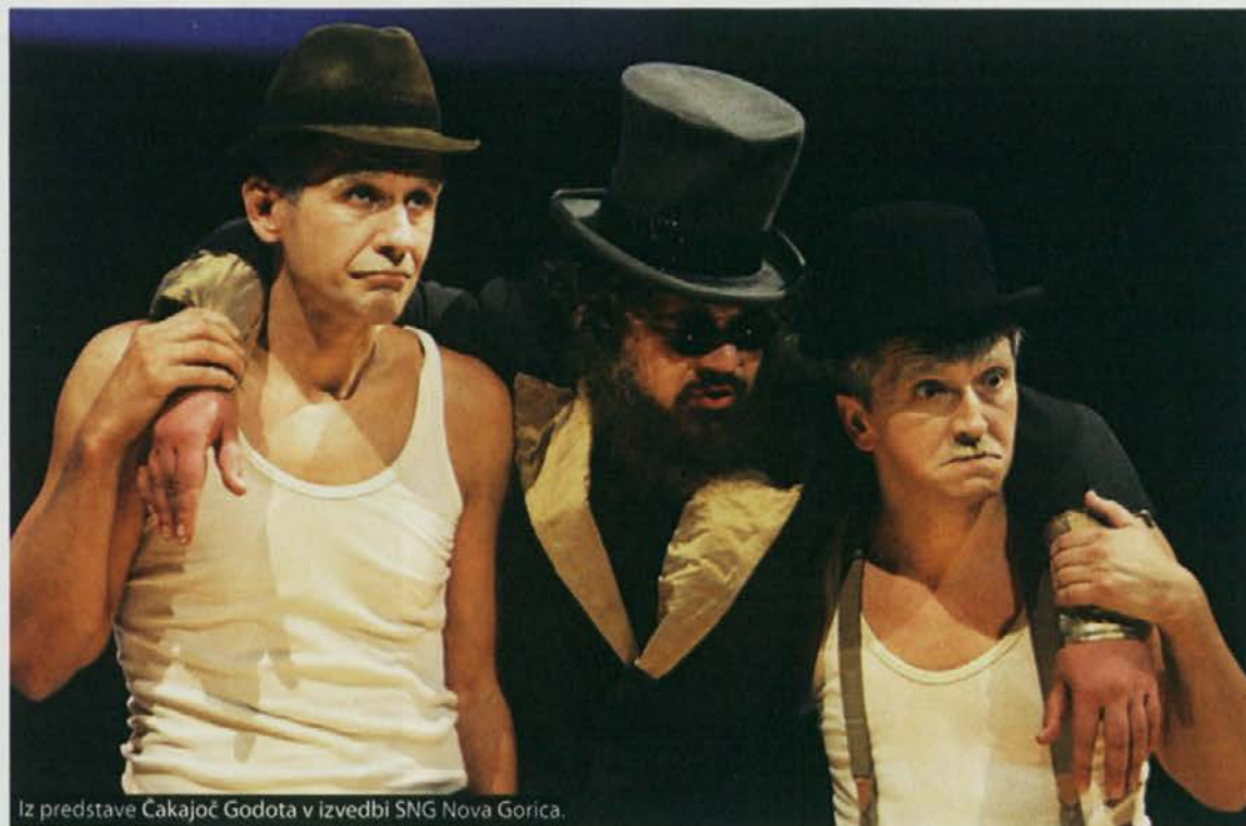
Iz predstave Čakajoč Godota v izvedbi SNG Nova Gorica.

gib konfliktna situacije in način za ustvarjanje socialnega miru. Vsi navidezni in na diskurzivni ravni trajajoči boji za večjo transparentnost in usklajenost propadajo. Prepuščeni smo prihodnosti. Čakajoč Godota. Je rešitev v oblikovanju radikalnih pozicij? Je napočil čas, da temeljito premislimo svoje lastne pozicije in si umislimo neko novo obliko proletarske revolucije s posegom v samo jedro kolonialne matrice moči, ki se projicira na vseh ravneh? Številni primeri na ravni neodvisnih organizacij so pokazali, da premoremo refleksijo, ne pa tudi poguma, s katerim bi se uprli in s katerim bi preprečili razmah nadaljnjih, grotesknih situacij, kot smo jim bili priča na sestanku za evropsko kulturno prestolnico. Še več, manjka nam enotnosti, ki je nujni pogoj za kovanje revolucije.