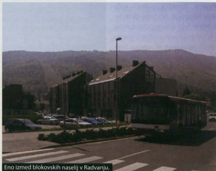
Eno izmed blokovskih naselij v Radvanju.

Med objekti arheologi izpostavljajo delavnico kamnitega orodja s številnimi izdelki in polizdelki ter omenjajo, da so na pričujočem najdišču raziskali tudi dva keltska oz. lateno-dobna objekta ter sledove štirih le-