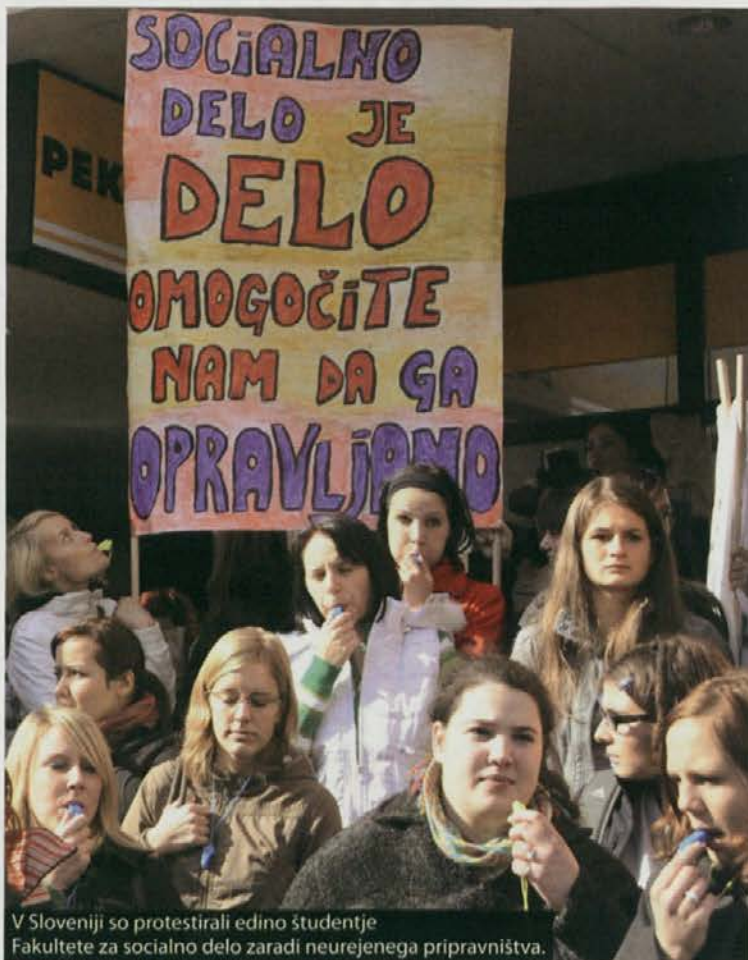
V Sloveniji so protestirali edino študentje Fakultete za socialno delo zaradi neurejenega pripravništva.