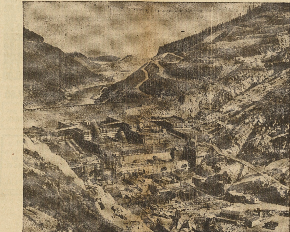
Hungry Horse. — Blizu 500,000 kubičnih yardov cementa so porabili za Hungry Horse jez, ki se dviga 174 čevljev visoko v globoki strugi Flathead Riverja v severozahodni Montani. Ko bodo vse naprave dograjene, bodo dajale 285,000 kilovatov električne sile.

patriaeque triumphum, Petacio lacrimas, nomina magna mihi. In vprašal bo nemara, kdo je bil ta Petacius." Vitez zasede konja in odjaše. Spotoma pa se obrne na starega, čemernega hlapca Jerneja ter ga ošteje, zakaj ga ni počakal pri grajskih vratih, kakor mu je velel.