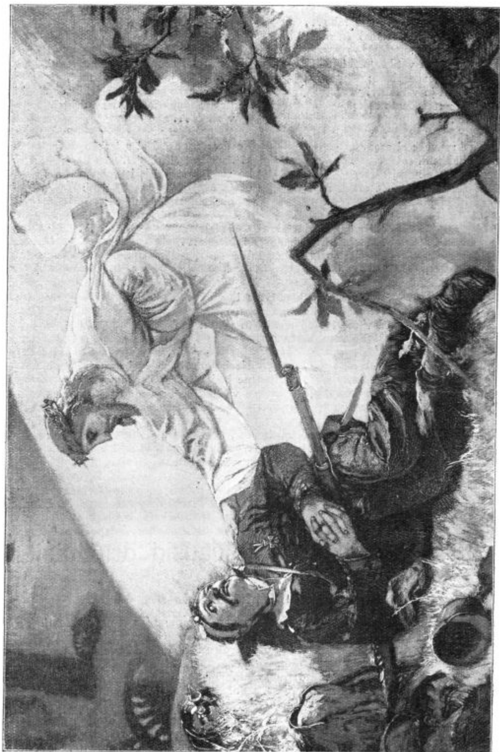
Mir s tabo!