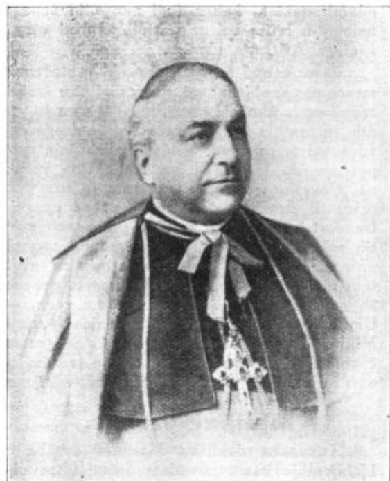
Kardinal Gasparri, državni tajnik sv. očeta.

Pozor! Za ranjence po bolnišnicah in lazaretih so se povsod pobirali časopisi, knjige in razni spisi, kar je vsekako hvalevredno. Toda bati se je, da se na ta način prikrade med vojaštvo marsikaj slabega. V nekem nemškem časopisu se nekdo naravnost zgraža nad tem, kaj vse donašajo ljudje ubogim ranjencem. Našel je znani umazani list »Simplicissimus«, ki je zdaj prepovedan, in nebroj drugih neumestnih in grdih stvari. Dobro bi bilo, da bi se tudi po naših bolnišnicah za ranjence popazilo, da vojaštvo ne bo dobivalo tudi duševnih ran.