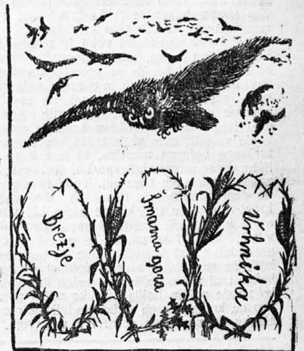
Iz svojih dupelj čak je ven pokukal mrtvaško pesem narodu sačukal, Brezje, Vrhnika in Šmarna Gora povsod je bila žalost in pokora.

17.329 kron 84 vin., godba 17.025 K 72 vin. V bodoči sezoni bi znašal deficit okroglo 4000 do 5000 kron. — Po tem takem se da slovensko gledališče v Ljubljani s pridnim delom in sodelovanjem vseh krogov ne le rešiti — ampak tudi povzdigniti — kolikor je v naših domačih razmerah in v splošnem duhu časa mogoče.