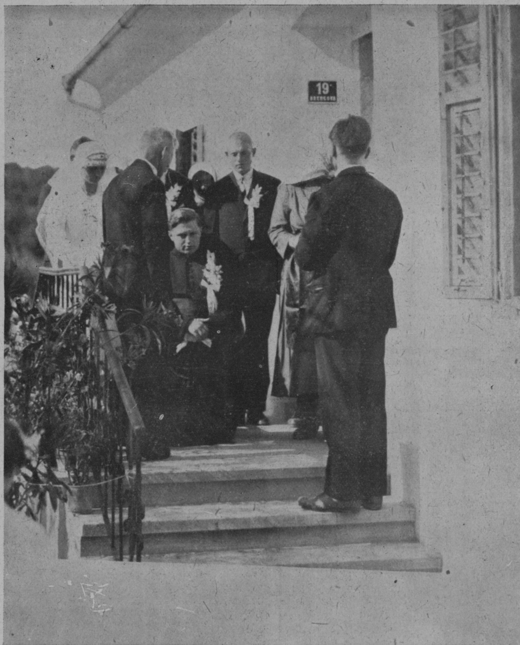
Blagoslov staršev pred odhodom novomašnika iz domače hiše