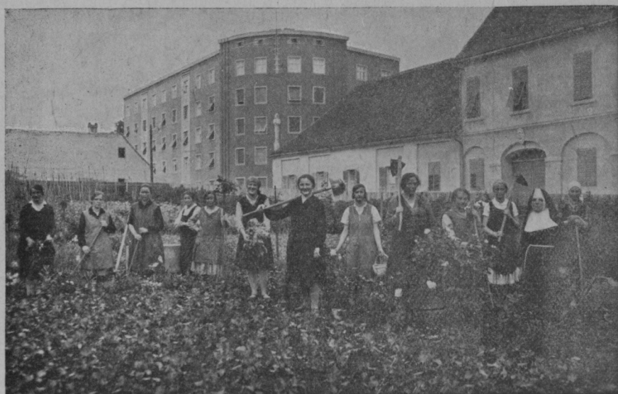
Udeleženke gospodinjskega tečaja pri šolskih sestrah pri delu na vrtu.

Letošnje romanje k Devici Mariji na Brezjah je bilo lepo in je poteklo brez nesreč. Za vzoren red so skrbeli reditelji. Slika nam kaže skupino rediteljev na Brezjah pri žigosanju izkaznic za polovično vožnjo.