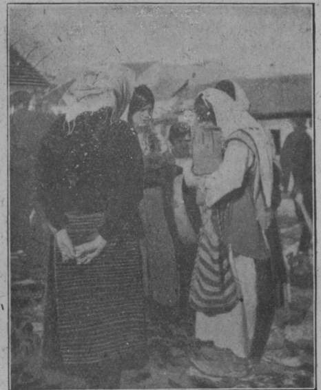
Ženske narodne noše iz banjaluške okolice. Kmetice se razgovarjajo po prodaji svojih pridelkov na trgu.

lovsko orožje: sulico, lok in pšico in neko metavko. Eskimi nimajo nikakih domačih živali in tudi ne severnih jelenov. Imajo pa, samo bogatejši, dobro izvežbane pse za vprego k sanem. — V poletju živijo Eskimi v lahko prenosljivih šotorih, po zimi pa si postavijo s posebno spretnostjo koče iz leda.