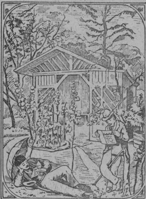
Skrivalnica. Kje je tretji bravec časnikov? Rešitev v inseratnem delu Slov. Gospodarja.

Japonci pravzaprav ne poznajo kakega poljedelstva, njihovo obdelovanje zemlje bi se moralo imenovati bolj vrtnarstvo. Posebno malo je pri njih razvita živinoreja. Glavna hrana kmetov in siromašnejših meščanov je žito in fižol in pa seveda riž, ki ga kuhajo, pravzaprav parijo, na poseben način. Mesa jedo Japonci zelo malo in to največ ribje meso v različnih pripravah. Japonska kmečka in meščanska hiša je enodružinska hiša iz lesa. Notranjost je zelo preprosta in pravilno razdeljena. Pohištva, postelj, miz in stolov v hišah ni. Okna so male štiroglate odprtine, ki so zakrite s pooljenim papirjem. — Življenje Japoncev je urejeno lepo in enostavno. Kakih velikih sprememb ne pozna japonski kmet. Ob velikem prazniku Bude in ob kaki poroki oživi kmečka hiša za dan ali dva. Slika na desni: Japonska kmečka hiša.