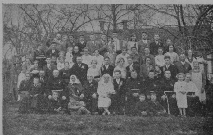
Zlato poroko sta obhajala zakonca šuta pri Sv. Trojici v Slov. goricah. Istočasno se je poročil tudi njun nečak.