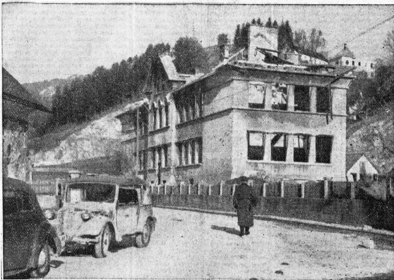
»Naša prosveta — naše orožje proti mračnjstvu«, se glasi eno izmed gesel, ki jih je razglasil rdeči prosvetni »minister« Zemljak za obvezno uporabo pri agitaciji za OF. Kako svojo prosveto izvajajo v dejanju, kaže gornja slika šole v Mediji-Iztrakah pri Zagorju, ki jo je »narodno-osvobodilna« vojska požgala lansko jesen.

Rez zanimivo in zaslužno delo za narod in še zanimivejša poglavitna odlika človeka, ki poleg Tita postaja glavni simbol »nove« Jugoslavije!