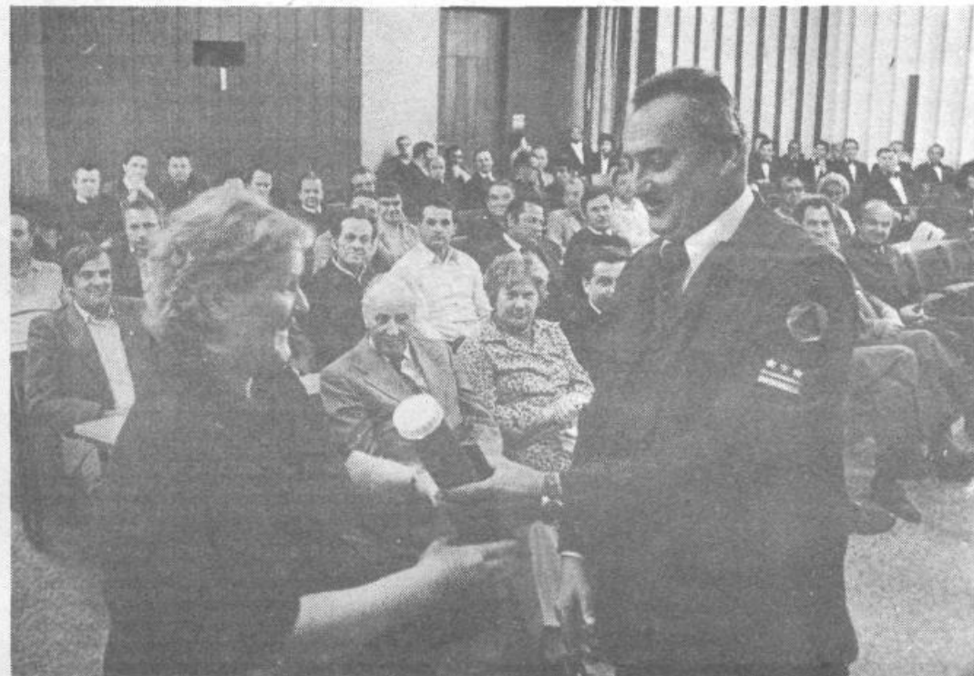
Letošnje tekmovanje prostovoljnih gasilskih enot je bilo množično!