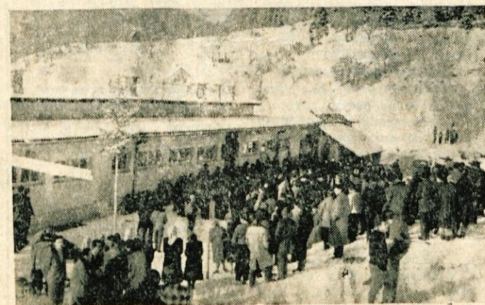
Zborovanje pred šolo v Dražgošah

Zjutraj ob 8. uri in 20 minut so na Kališču nad Dražgošami startali prvi tekmovalci smučarskega teka