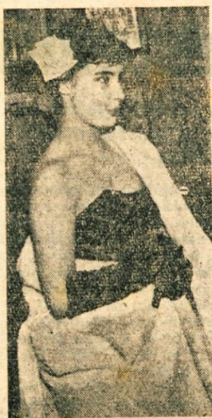
ZVEZDICA JE ZASENCILA ZVEZDE.

Mlada sovjetska filmska igralka Tatjana Samoilova je na letošnjem filmskem festivalu v Cannesu v hipu osvojila žirijo in občinstvo. Z vlogo v filmu »Lete žerjavje« je dokazala, da sodi med najboljše igralko na svetu.