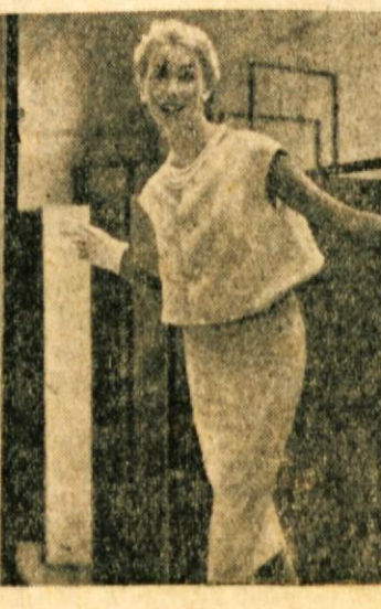
DVA MODELA POLETNI OBLEK IZ PLATNA ALI POPELINA