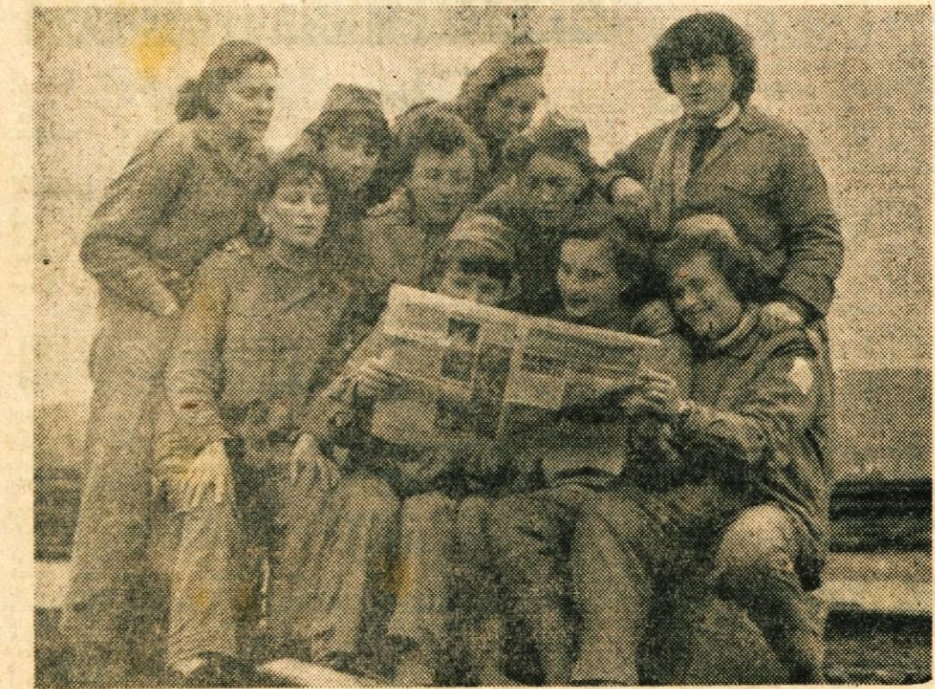
Takole je vsako soboto in nedeljo, ko pride v brigade »MLADOST«, glasilo mladih graditeljev avto ceste BRATSTVA IN ENOTNOSTI. Uredništvo lista je pri Glavnem štabu v gradu Otočec. List pa tiskajo pri Slovenskem poročevalcu v Ljubljani. Posebna »mladinska brigada« in tiskarski skrbi za živahno in čedno opremo lista, ki slovi po pestri razgibanosti in zanimivi vsebini. Naj reči: tudi list je tak kot vsa mladina vzdolj nove ceste: poln navdušenja, poleta in veselja nad vsem novim, kar diha in živi z novo cesto...

O dviganju potopljenih zakladov sanjajo številni ljudje povsod na svetu. V zalivu Vigo, ki leži v severozahodnem delu Španije, se je pred približno 250 leti potopilo nekaj ladij, natovornih z zlatom in srebrom. Ta zaklad so doslej skušali že večkrat dvigniti, a brez uspehov. Pred kratkim so poskušali znova, toda namesto ladje z zlatniki so našli le na nekaj topov stare angleške fregate