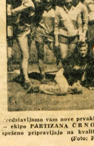
Predstavljamo vam nove vrakinje Slovenije v našem roketu — ekipo PARTIZANA CRNOLELJ. Zdjaj se na Vinici spesešno pripravljajo na kvalifikacijske tekme za zvezno ligo

TV D PARTIZAN NOVO MESTO : OK »KRIM« LJUBLJANA 3:0 TV D PARTIZAN NOVO MESTO :OK »GRAFICAR« LJUBLJANA 2:3 V soboto in nedeljo so novomeške odbojkarice odigrale zadnji dve tekmi spomladanskega delna zenske odbojkarice lige. V Ljubljani so se pomerile s Krimom in Graficajem. V sobotni tekmi so našle na šibkega nasprotnika in so zmagale s 3:0, zadnji set se je končal celo 15:1. V nedeljski tekmi pa so igrale za postrvovalno ekipo Graficarja, ki je do sedaj doživela le poraz v Mariboru. Po dramatični borbi v petih setih se je sreča nasmešnila domačini, saj so v zadnjem setu pri stanju 14:13 za goste uspeli zmagati s 15:14. Z igro naših odbojkaric ne smemo biti nezadovoljni, ker so kljub porazu igrale zelo dobro. S to tekmo so naše odbojkarice zasedle tretje mesto in upamo, da bodo v jesenskem delu napredovale do drugega mesta za ekipo Maribora, ki se bo borila za vetop v zvezno ligo.