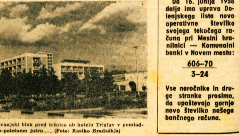
Novi stanovanjski blok pred tržnico ob hotelu Triglav v pomladno-poletnem jutru...

Od 16. junija 1958 dalje ima uprava Dolenskega lista novo operativno številko svojega tekočega računa pri Mestni hranilnici — Komunalni banki v Novem mestu: