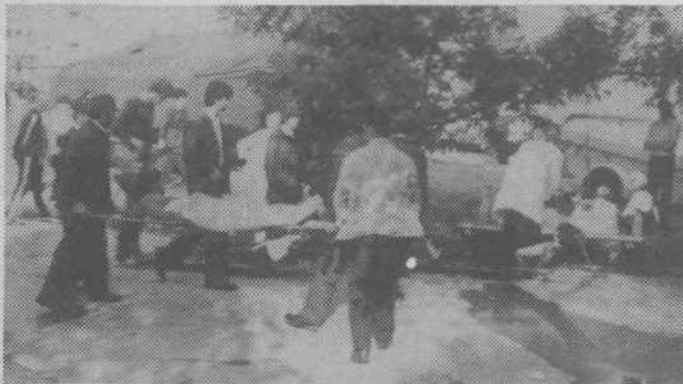
Zelena jama: Prva pomoč je takoj začela delovati