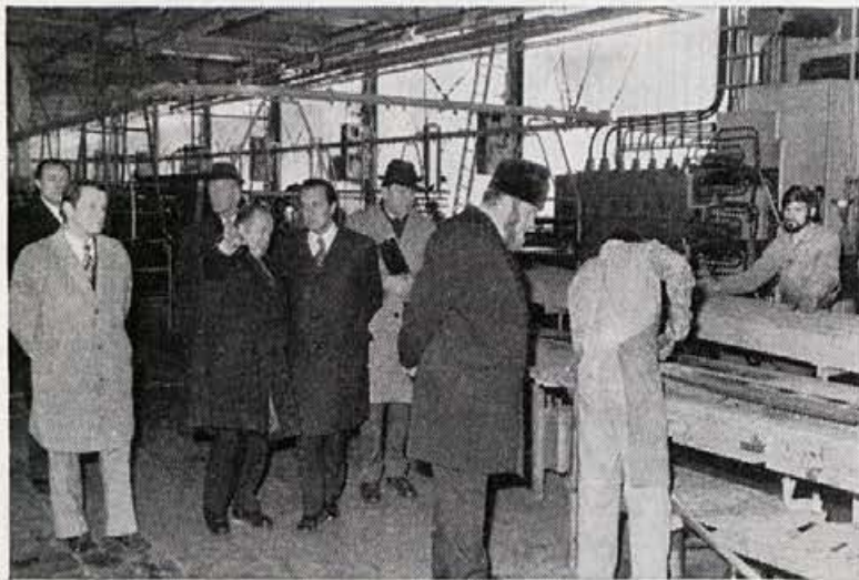
Z zanimanjem so spremljali potek proizvodnje