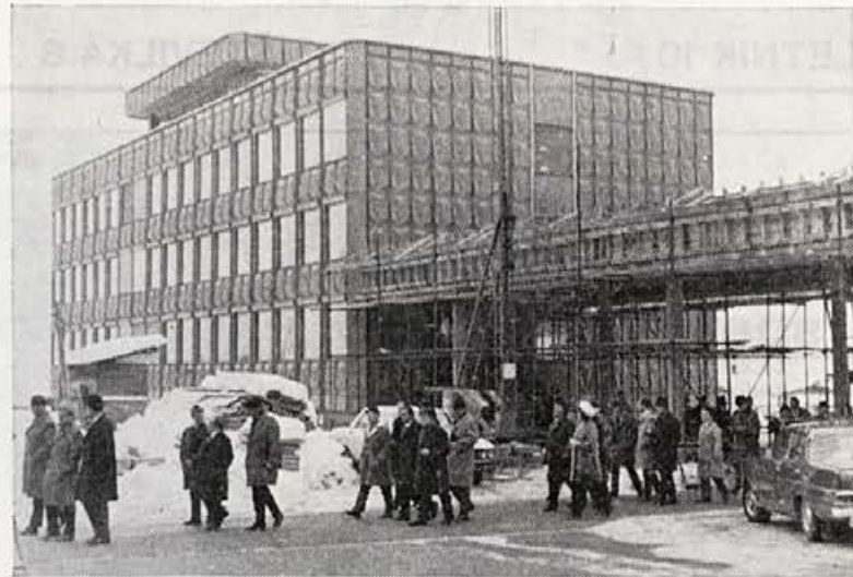
Povabljeni gostje na poti iz upravne zgradbe v obrate