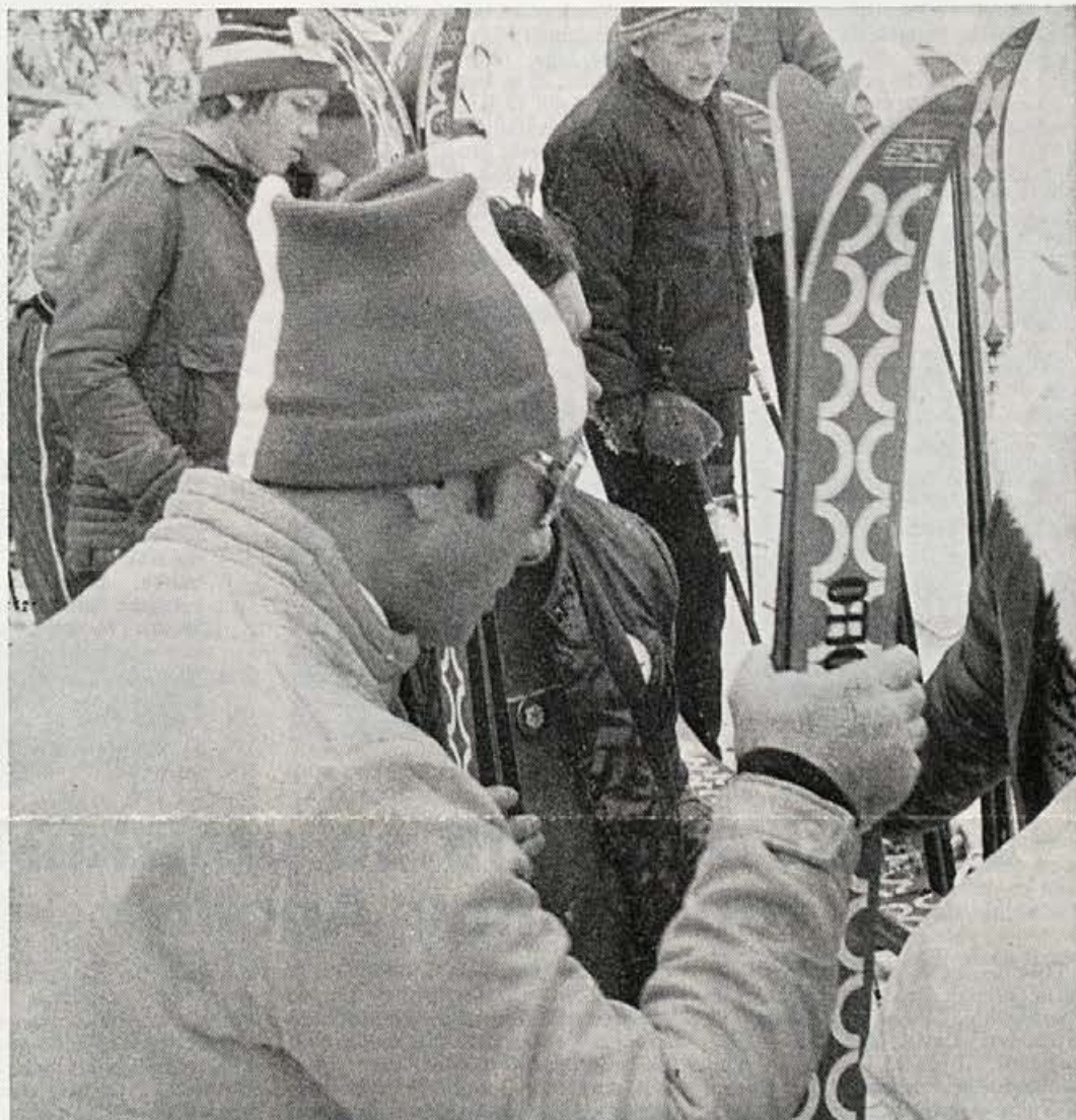
Astronavt James B. Irwin izbira naše smučl