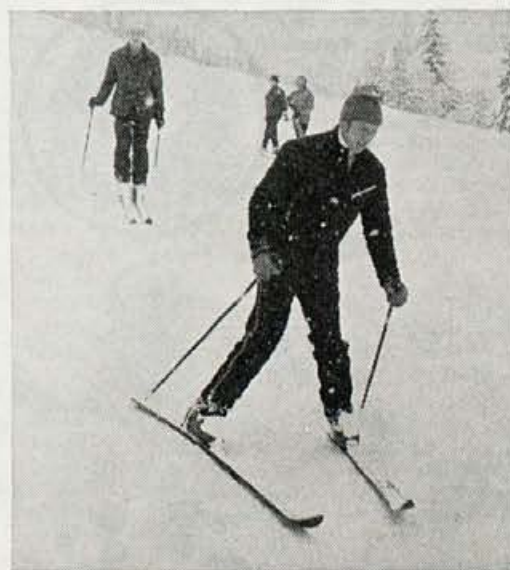
Poveljnik Apolla 15 polkovnik David R. Scott..