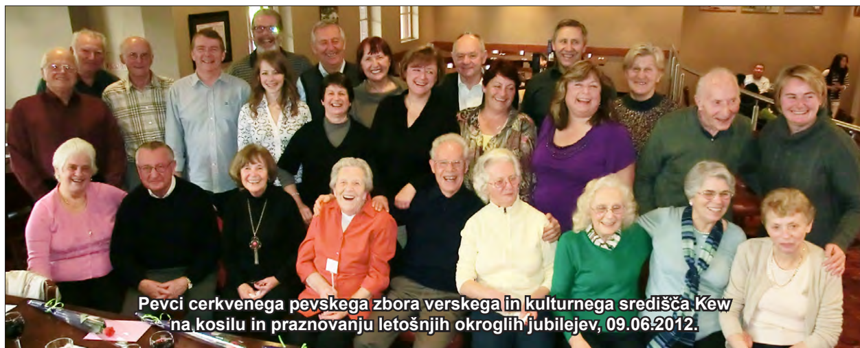
Pevci cerkvenega pevskega zbora verskega in kulturnega središča Kew na kosilu in praznovanju letošnjih okroglih jubilejev, 09.06.2012.

SKUPNO OBHAJANJE ZAKONSKIH JUBILEJEV bomo praznovali tretjo nedeljo v oktobru, 21. oktobra 2012. In že bomo v novembru, v mesecu spomina in pomnoženih molitev za naše pokojne. Prvo nedeljo, 4. novembra 2012, bodo molitve na pokopališču