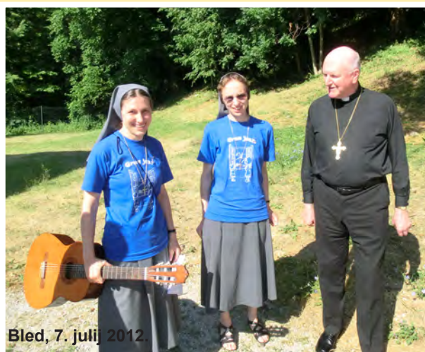
Bled, 7. julij 2012.