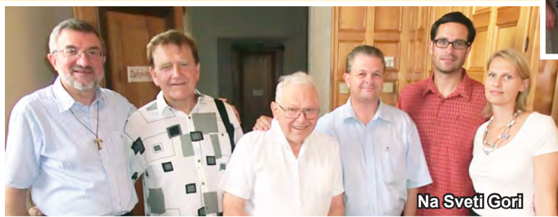
Na Sveti Gori