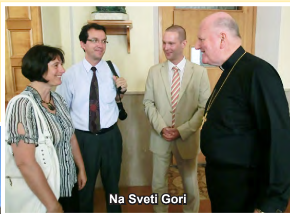
Na Sveti Gori