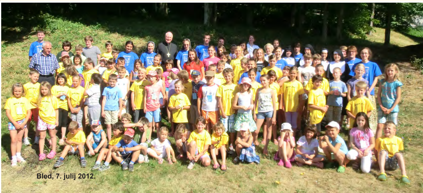
Bled, 7. julij 2012.