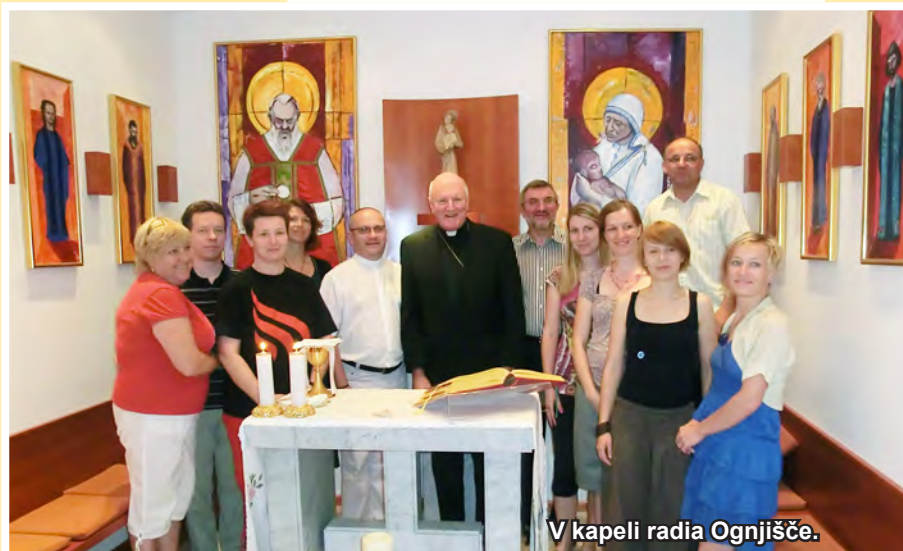
V kapeli radia Ognjišče.