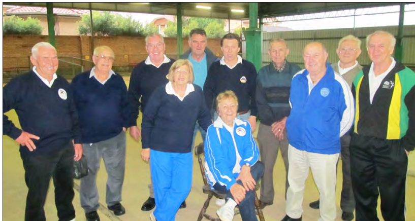
Prve štiri zmagovalne ekipe na balinarskem tekmovanju.