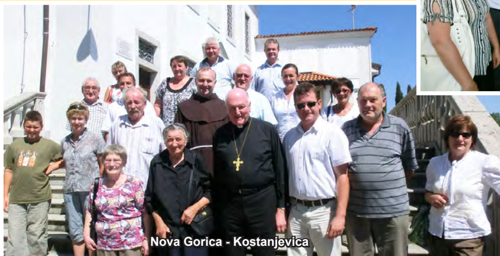
Nova Gorica - Kostanjevica