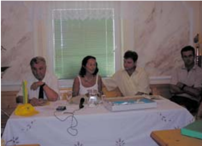
Okrogla miza na temo spominki