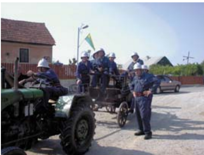
Gasilci PGD Desenci s staro gasilsko brizgalno