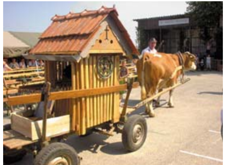
Konjska vprega s studencem