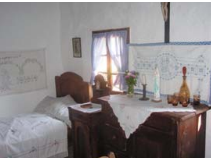
Notranjost Škarjakovega muzeja