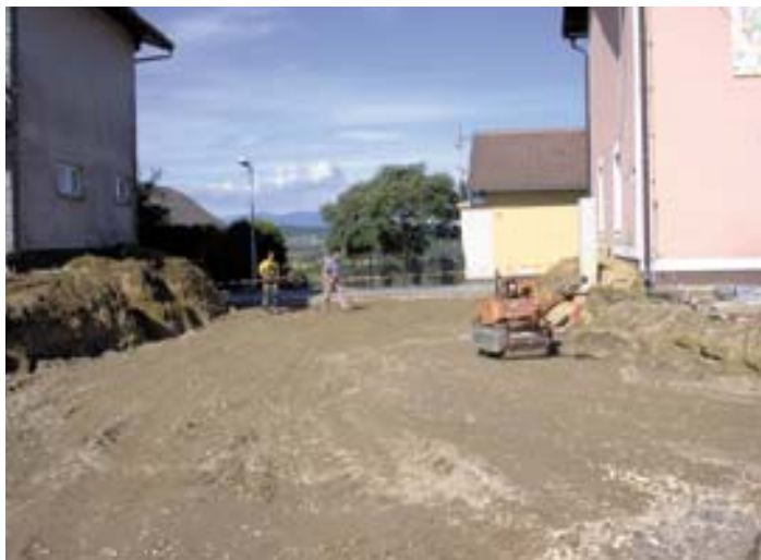
Ureditev križišča pri gasilskem domu na Destrniku