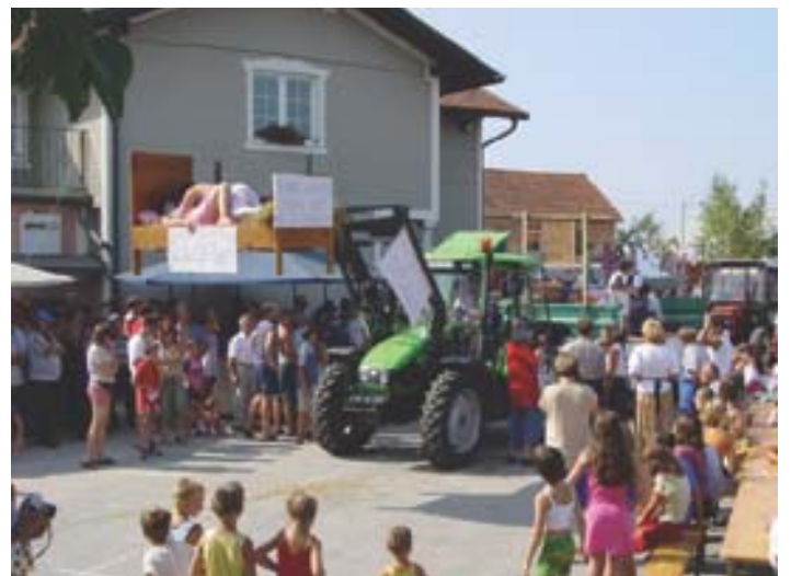
»Na mladih svet stoji, za stare pa nja občina poskrbi!«, so v povorki menili Levanjčani