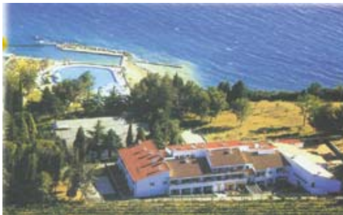
Mladinsko zdravilišče na Debelem Rtiču in »naš zunanji bazen«

V soboto, 14. junija 2003, smo se z dvema avtobusoma odpeljali proti Primorski. Na poti na morje smo si z zanimanjem ogledovali pokrajino in bolj ko smo se približevali Primorski, bolj se je pokrajina spreminjala. Okoli 12. ure smo prispeli na Debeli Rtič, odložili prtljago, se najedli in si ogledali obalo. Veseli smo bili bazena, saj smo si le težko predstavljali kopanje v morju, ki je bilo »okrašeno« z morskovo travo.