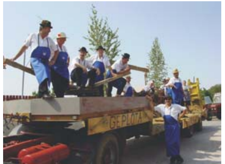
Občinski svetniki so letos spet mlatili. Kaj, presodite sami.