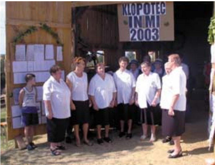
Urbančanke ob Škarjakovem muzeju