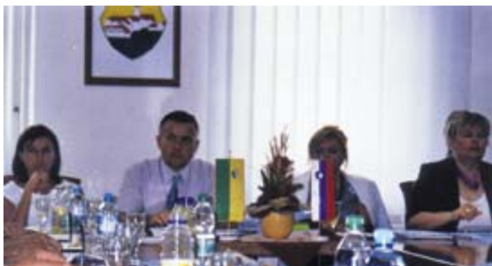
Občan - 14. oktober 2003