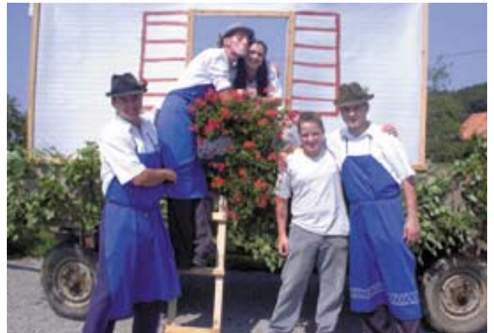
Podoknica mladih Jiršovčarjev