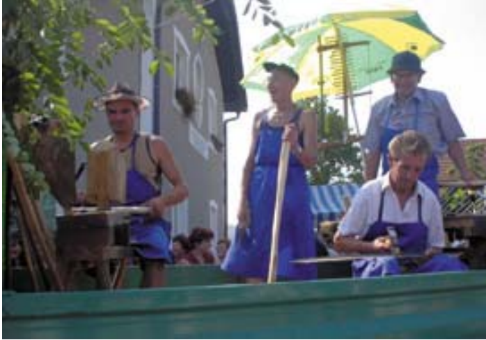
Popravilo starega orodja