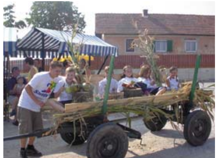
Najmlajši folkloristi KD Destrnik se predstavljajo