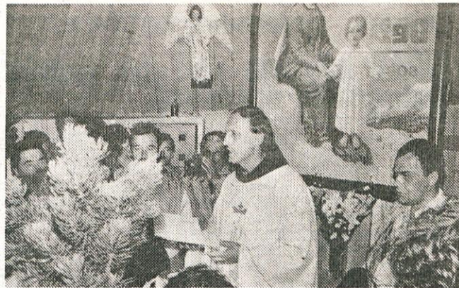
Poročni obred v kapeli Marije Snežne