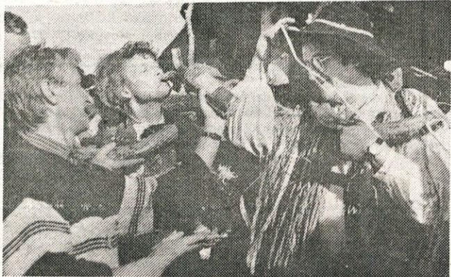
Mladoporočena sta še enkrat skočila v zakonski oziroma volovski jarem