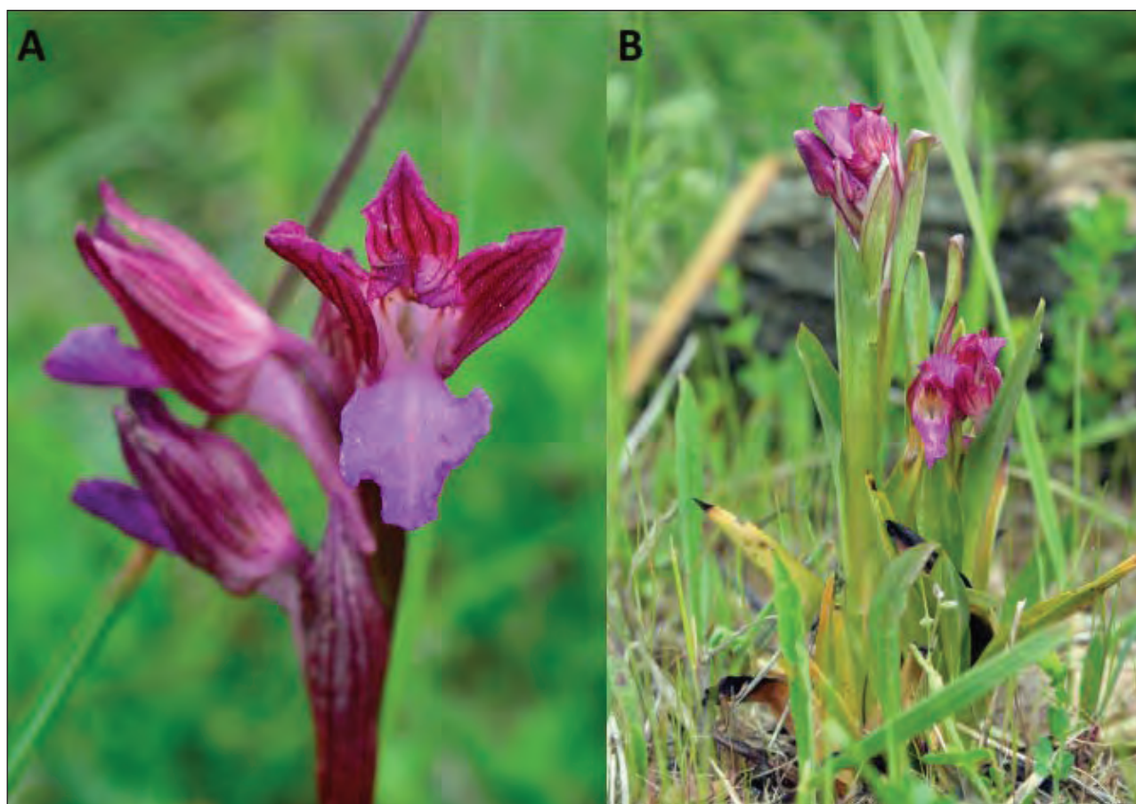
Sl. 2: Metuljasta kukavica ( Anacamptis papilionacea ): A- Primorska, Istra, vzhodno od naselja Sv. Anton, B- Prekmurje, Goričko, Fokovci.

0449/3 Slovenija: Primorska, Istra, vzhodno od naselja Sv. Anton, suh travnik na flišu, 342 m. Det. I. Paušič & Ž. Cenc, 10.5.2016.