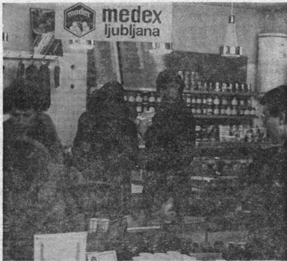
Svet potrošnikov krajevne skupnosti Savsko naselje je sredi decembra — v sodelovanju z Medexom in Mercatorjem (Emona žal ni pokazala razumevanja) — priredil pokušno več kot 10 vrst medu in medenih napitkov. Zanimanje je bilo zelo veliko. Posebno degustacijo so priredili tudi na osnovni šoli Borisa Kidriča.