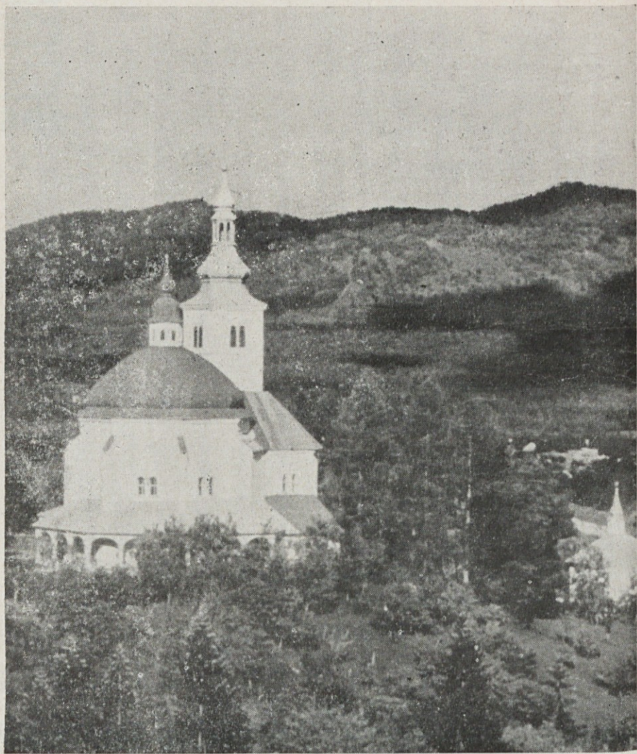
Nova Štifta pri Ribnici na Dolenjskem — znana Marijina božja pot