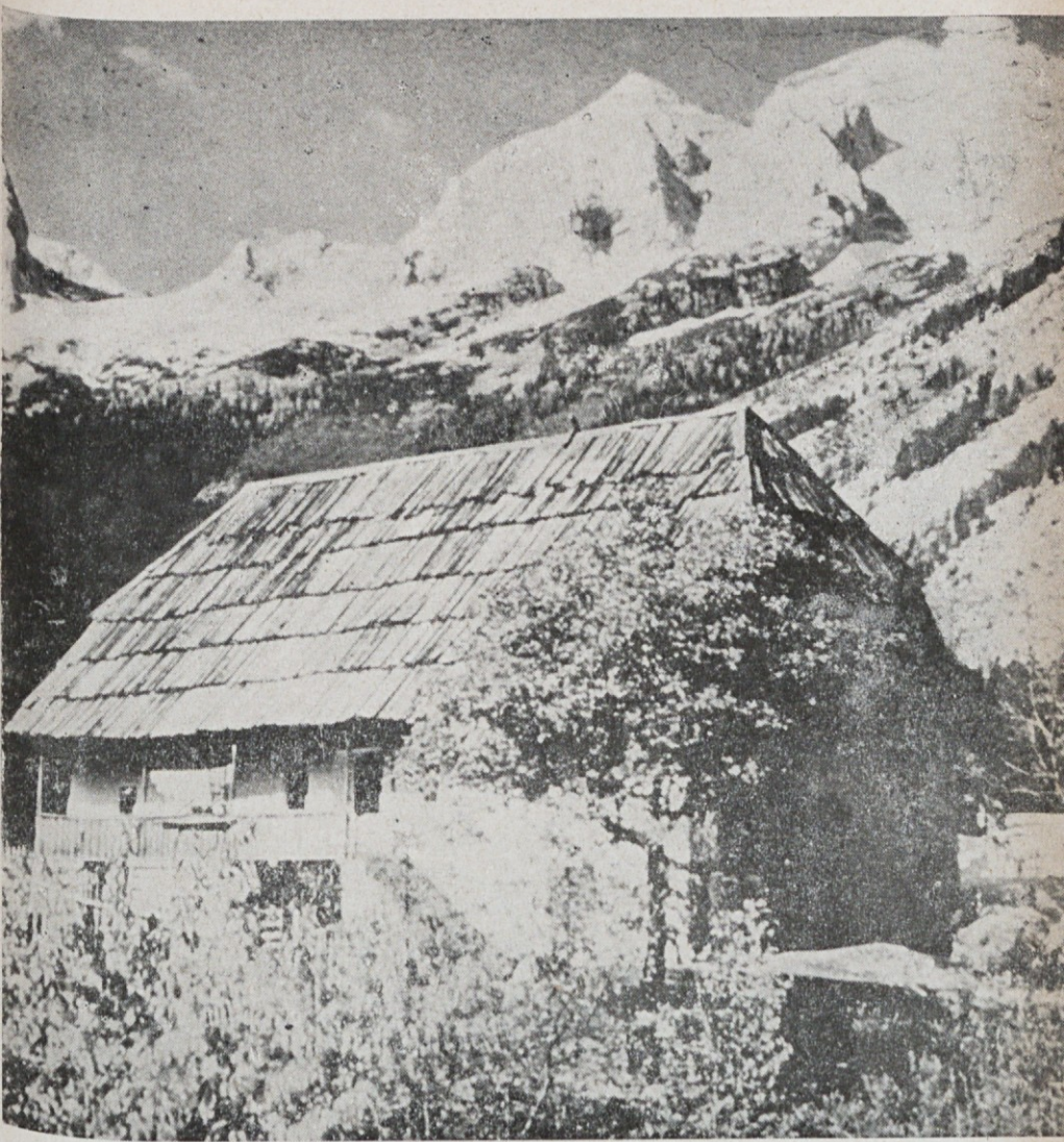
Trenta — blizu izvira Soča