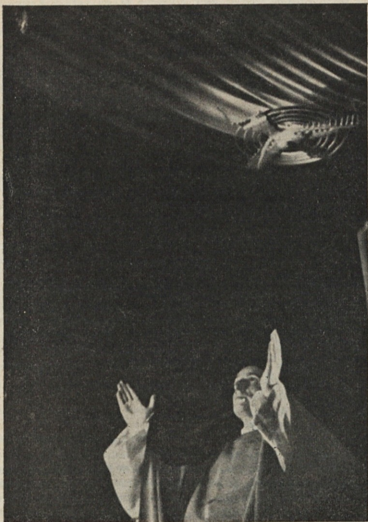
Zemeljsko bogoslužje je predpodoba nebeškega